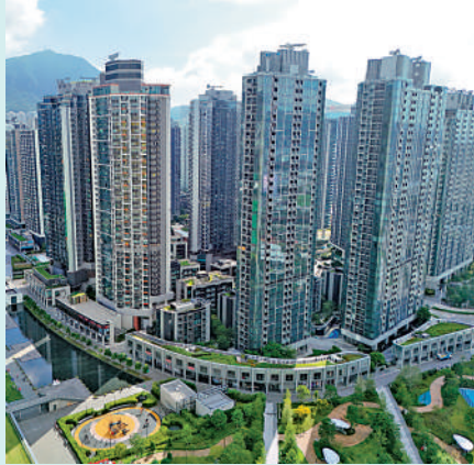
▲本年新盤交投突破2萬宗，創出一手住宅物業銷售條例實施以來新高。