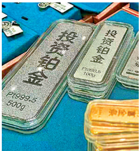
▲商家推出黃金、鉑金金條吸引了許多投資者。