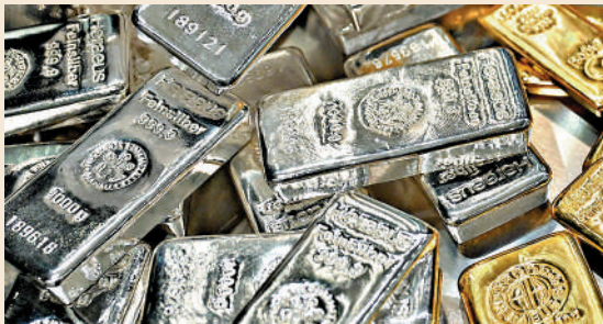
▲貴金屬已成為投資者明年投資的熱門選項。

OANDA高級市場分析師Kelvin Wong： 白銀有潛力明年上半年達到每盎司90美元 華爾街經濟學家彼得·希夫： 銀價明年衝上每盎司100美元是可實現的目標 經濟學家、金融分析師兼暢銷書《貨幣戰爭》作者吉姆·里卡茲： 黃金和白銀在明年迎來「爆炸性」上升，金價達到1萬美元、白銀也上漲至200美元