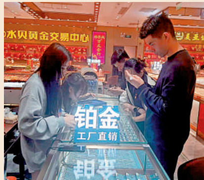
▲鉑金飾品價格半年漲幅接近一倍，顧客問價也被嚇了一跳。

鉑金近期的價格漲幅也驚人，國際現貨鉑金上漲逾5%至每盎司2333.85美元。廣期所鉑期貨主力合約