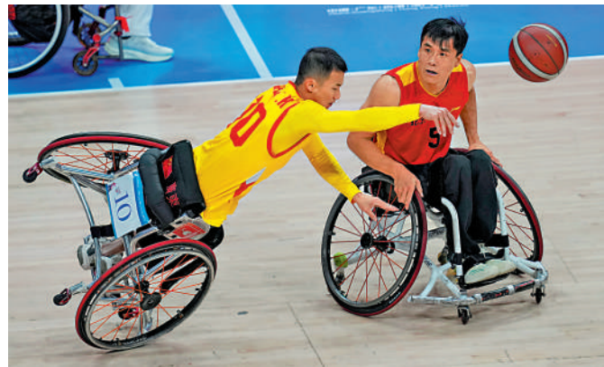
◀輪椅籃球男子組金牌戰，廣東隊（黃衫）戰勝北京隊奪得冠軍。

4 緊接全運會的殘特奧會在12月8至15日於粵港澳聯辦下圓滿舉行，這是粵港澳首次承辦全國殘特奧會，充分體現國家對殘疾人事業的高度重視。賽事的代表團規模和大眾項目報名參賽運動員數量均創新高，整個賽事創出15項世界紀錄及156項全國紀錄，運動員超越自我的意志，展現激勵人心的精神面貌。