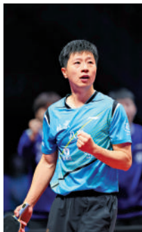
▲馬龍實現「全運金牌大滿貫」。

3 全運會上老將賽場上綻放餘暉，乒壇名將馬龍贏得男團金牌，圓夢實現盡取男單、男雙、混雙、男團的金牌大滿貫；汪順以19枚金牌成為「全運多金王」；鞏立姣強忍痛楚膺5連冠；石智勇實現3連冠。其餘尚有劉詩雯、張常寧、鄭思維、黃雅瓊等，無論奪冠還是未如人意無法奪獎，同樣叫人敬佩。