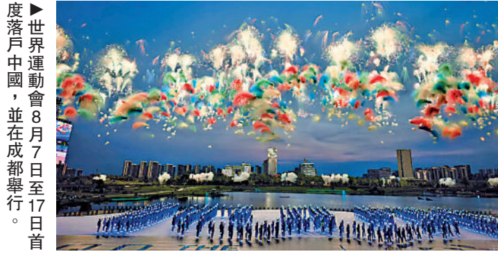
度落戶中國，並在成都舉行。

6 首屆由中國舉辦的世界運動會，今年8月7日至8月17日在成都順利舉行。賽事共設34個大項，吸引約4000名運動員參賽，是歷屆之最。中國代表團以36金17銀11銅位居獎牌榜首位，中國香港代表團亦奪得3金2銀1銅的佳績。同時，本屆賽事亦多次使用創新科技，向世界展示中國擁抱未來的新姿態。