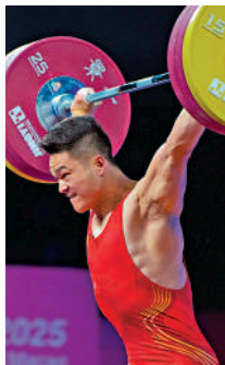
▲石智勇舉重取得3連冠成就。