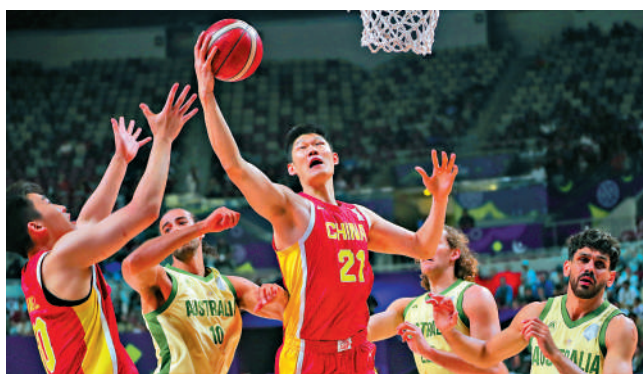
▶中國男子籃球隊（紅衫）今年亞錦賽決賽，一分之差僅負澳洲。

10 中國男子籃球隊近年成績飄忽，但就在今年亞洲盃勇奪亞軍，讓外界驚喜。面對實力強勁的澳洲，中國男籃打出了近年國際賽最佳表現，雖然以1分惜敗屈居亞軍，但就贏得大批球迷的尊重及掌聲。球隊中有多名年輕球手皆展現出不俗潛力，讓眾人對中國男籃的未來注入充足的信心。