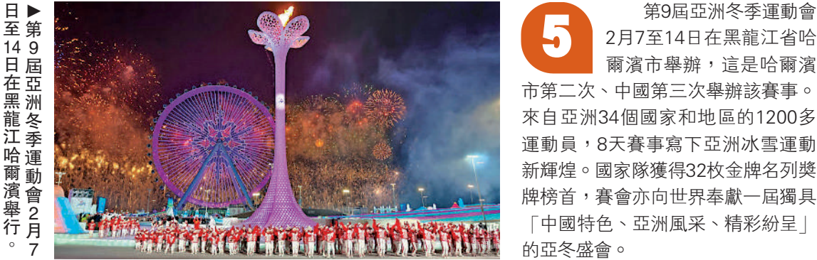
日至14日在黑龍江哈爾濱舉行。

5 第9屆亞洲冬季運動會2月7至14日在黑龍江省哈爾濱市舉辦，這是哈爾濱市第二次、中國第三次舉辦該賽事。來自亞洲34個國家和地區的1200多運動員，8天賽事寫下亞洲冰雪運動新輝煌。國家隊獲得32枚金牌名列獎牌榜首，賽會亦向世界奉獻一屆獨具「中國特色、亞洲風采、精彩紛呈」的亞冬盛會。