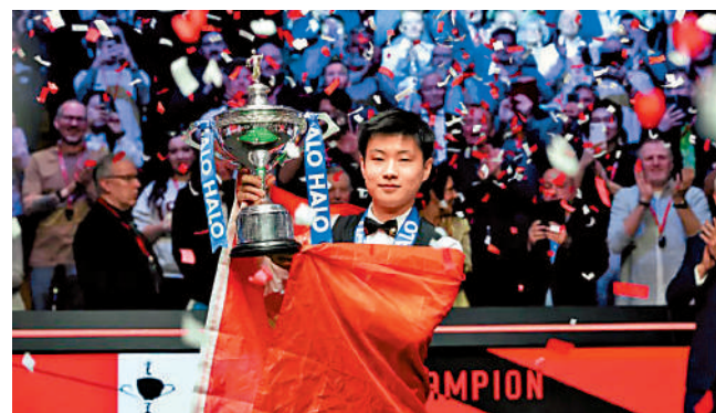
◀28歲的趙心童4月勝出桌球世錦賽，開創中國桌球歷史。

8 中國桌球新星趙心童自重返賽場後，便展現出驚人的競技狀態。他在今年4月的桌球世錦賽中，以業餘球手參賽從外圍賽起步，他一路過關斬將，最終晉級決賽，並以18：12戰勝威爾士名將威廉斯，成為中國桌球史上首位世界冠軍，這個冠軍亦是「中國軍團」在桌球歷史上的重要里程碑。