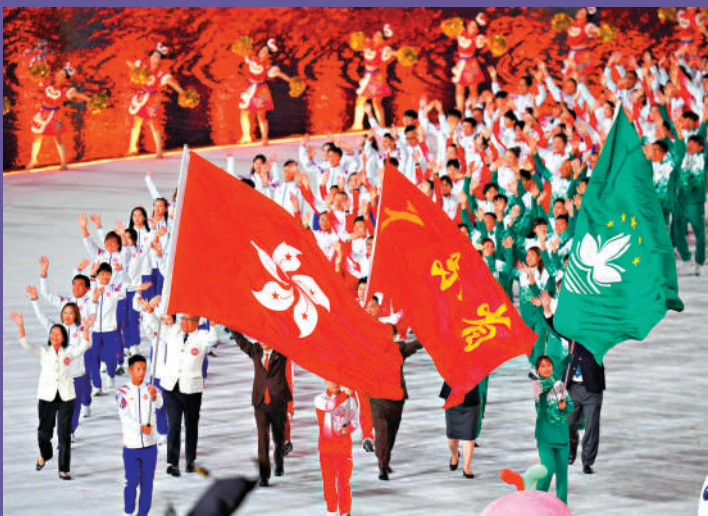
▲全運會開幕式上，粵港澳三地代表團一同進場。