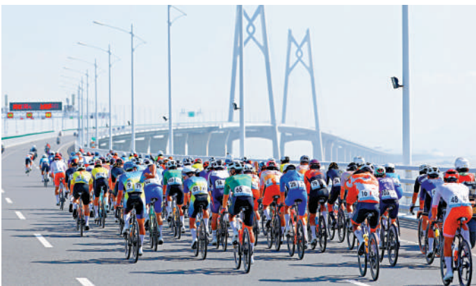
◀全運會跨境公路單車男子個人賽，港珠澳大橋是主要比賽賽道。

1 第15屆全國運動會於11月9至21日在粵港澳聯合承辦下圓滿舉行。運動員除在三地賽場爭逐，亦在港珠澳大橋上單車競速，在深港跨境路段馬拉松開跑，見證三地從「硬聯通」到「軟聯通」，從「地域相鄰」到「心靈相通」的深度融合。更令人鼓舞是賽事打破8項世界紀錄及13項亞洲紀錄，成績驕人。