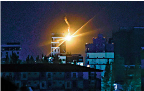
▲泰軍26日對柬埔寨班迭棉吉省的小鎮波貝發動空襲。

泰國與柬埔寨邊境衝突已持續數月，地雷問題則數次引起局勢緊張。今年以來，泰柬邊境至少有10名泰國士兵被地雷炸傷，泰方指控這些地雷是柬埔寨「新埋設」的，柬方則表示地雷為1990年代內戰所遺留。7月，泰柬雙方在邊境地區發生長達5天的衝突，造成至少48人死亡，30萬人流離失所。雙方當月達成停火協議，並於10月簽署和平聲明。但隨後泰國士兵再次踩雷受傷，泰方單方面暫停執行停火協議。本月7日起，泰柬衝突進入白熱化階段，雙方互指對方「先開火」。此輪長達20天的衝突造成雙方至少101人死亡，超過50萬平民流離失所。