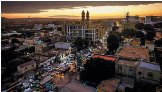
▲以色列26日宣布承認索馬里蘭為「獨立主權國家」，引發多方強烈譴責。圖為索馬里蘭最大城市哈爾格薩市。

美國總統特朗普26日表示，不打算立即效仿以色列，承認索馬里蘭為「獨立主權國家」。「真的有人知道索馬里蘭是什麼嗎？」他問道。對於索馬里蘭提出向美國提供位於具有戰略意義的亞丁灣港口的通道，特朗普不屑一顧地回應說：「有什麼