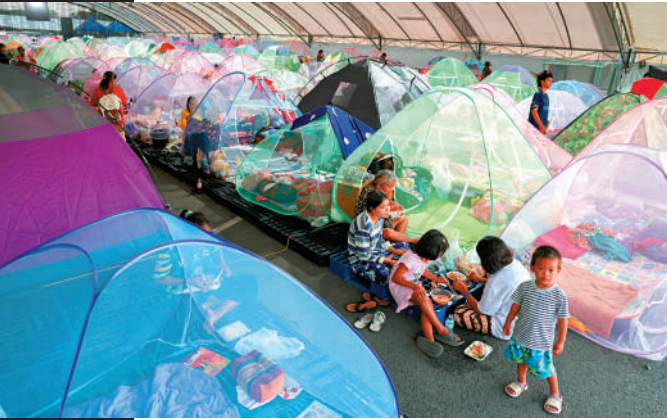
▲受泰柬邊境衝突影響，泰國邊境難民所內。

根據泰柬聯合聲明，雙方同意在邊境地區維持現有兵力部署，不得進行任何調動或增兵，不得採取任何可能升級緊張局勢的挑釁行動。聲明還承諾，讓居住在邊境地區的平民盡早、不受阻礙、安全且有尊嚴地返回家園並恢復正常生計。聲明要求，在停火完全維持72小時後，泰國將依據國際慣例，釋放全部18名被俘的柬埔寨士兵。雙方還同意將邊界勘測和劃界工作交由聯合邊界委員會盡快恢復，以符合兩國為實現邊境持久和平而達成的現有協議。泰國方面為實現停火提出明確條件，雙方必須正式、真誠宣布停火，停火必須落實並持續，必須真誠地解決邊境地雷