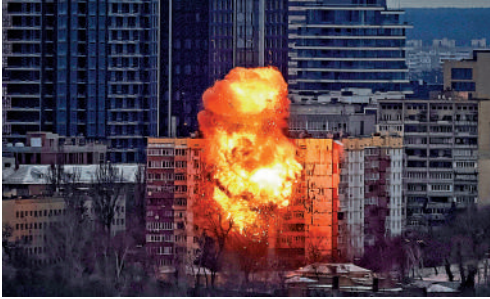
▲烏克蘭基輔一棟公寓樓27日遭俄羅斯無人機襲擊。路透社

【大公報訊】綜合美聯社、路透社報道：27日凌晨起，俄軍對烏克蘭首都基輔等多地發起大規模空襲。基輔全市實施緊急停電，並大面積停暖。當天凌晨1時30分防空，基輔響起空襲警報，爆炸聲與烏軍密集防空火力作業聲整夜轟鳴，直至11時20分左右結束，當局表示，襲擊造成基輔至少1人死亡，10人受傷，其中包括兩名兒童。烏克蘭總統澤連斯基27日在其官方社交平台發文稱，當天俄軍用近500架無人機以及包括「匕首」導彈在內的40枚導彈襲擊了烏克蘭，導致基輔市及周邊部分地區電力及供暖中斷，多棟普通居民樓受損。烏克蘭最大私營能源企業DTEK27日在社交媒體發文稱，空襲導致基輔市近三分之一區域停暖。該公司按照烏克蘭電力公司下達的指令，對基輔市全市停電。報道指，空襲