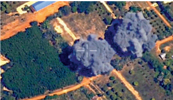
▲泰軍15日視頻顯示，泰國對柬埔寨境地區發動空襲。

根據泰國與柬埔寨27日簽署的停火聯合聲明，雙方於當天中午12時起實施停火，承諾結束持續數周的邊境衝突。中國外交部發言人27日表示，中方歡迎柬泰簽署停火聯合聲明，這表明對話協商是解決複雜爭端的現實有效途徑。此外，應外交部長王毅邀請，柬埔寨副首相兼外交大臣布拉索昆、泰國外交部長西哈薩將率團於12月28日至29日赴雲南舉行會晤。