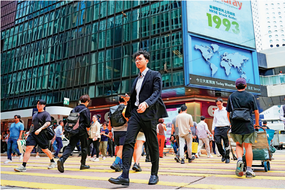
▲在國家「十五五」時期，香港除了繼續鞏固國際金融中心城市地位優勢，也要推動建立國際高端人才集聚高地，以及加快國際創科中心中心建設。