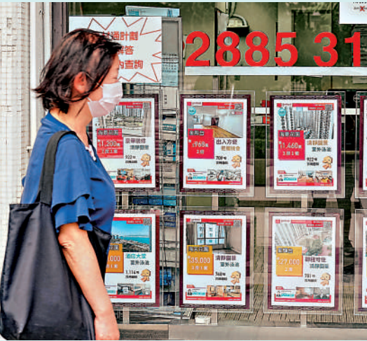
▲去年減息期至今，置業人士的供樓負擔有所減輕之外，上會人士的入息要求亦降低。