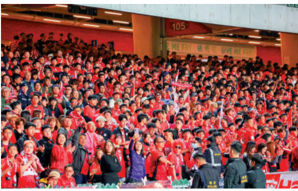
►部分球迷穿上港足球衣替港隊打氣。