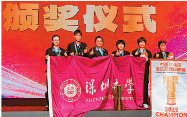
▲乒超冠軍深圳大學隊在頒獎儀式上。

【大公報訊】記者譚德龍報道：在江蘇南京舉行的2025賽季中國乒乓球俱樂部超級聯賽總決賽，有「一哥」王楚欽在陣的山東魏橋向尚運動隊於28日晚男子團體決賽，以總比分3：0擊敗黃石華新隊。女子團體方面，深圳大學隊憑藉穩定發揮，在決賽上以總比分3：1擊敗山東魯能隊而奪得冠軍。