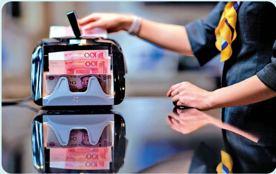
▲人民幣業務資金安排第二階段已於12月1日開始，參與銀行名單已擴大至40家。