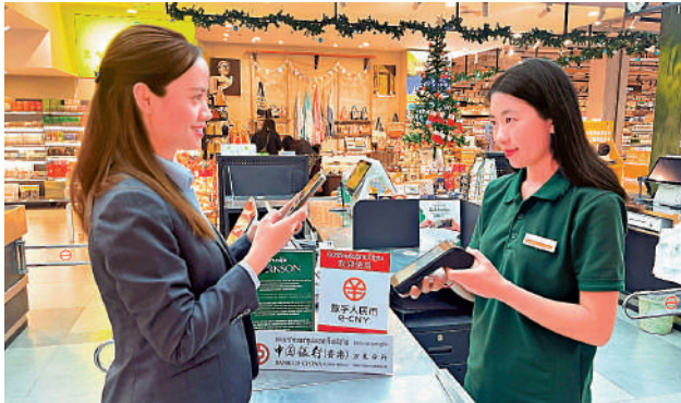
◀中銀萬象分行已於老撾成功對接數字人民幣跨境支付平台。