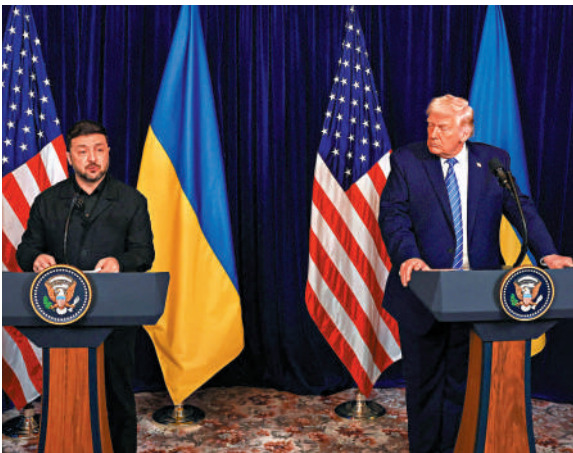
▲特朗普（右）28日與澤連斯基舉行會晤。

澤連斯基29日否認俄方指控，並指責俄方在為襲擊基輔政府大樓找藉口。 參與美烏領導人會晤的美方人員包括國務卿魯