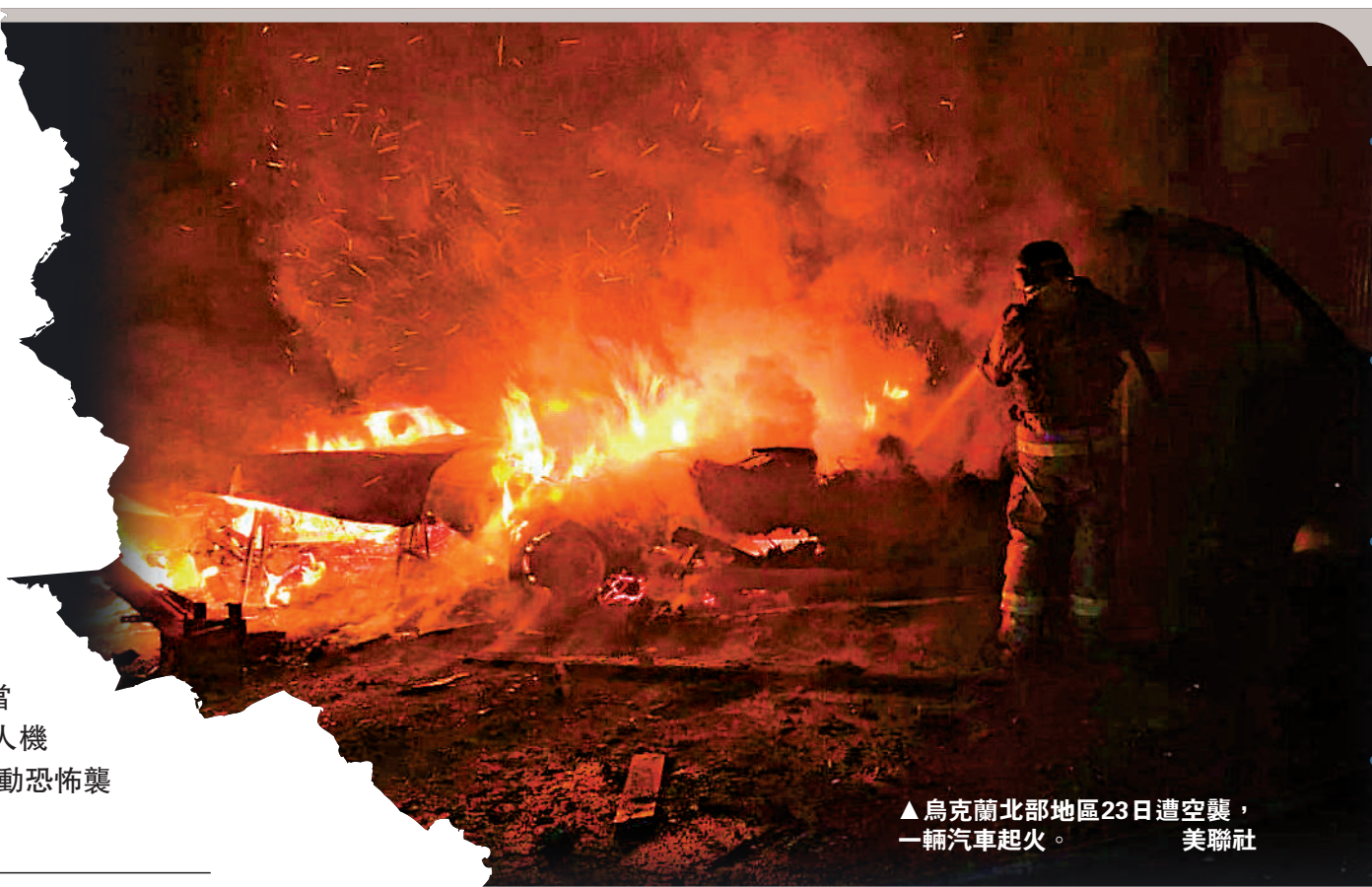
▲烏克蘭北部地區23日遭空襲，一輛汽車起火。

美國總統特朗普28日與烏克蘭總統澤連斯基在美國佛州會晤，雙方均聲稱「取得很大進展」，但在領土等最棘手問題上仍未能達成一致，今年內結束俄烏衝突的希望破滅。至於安全保障問題，澤連斯基稱，美烏擬定的相關文件將安全保障有效期定為15年，但烏方希望將期限延長至50年。俄羅斯外長拉夫羅夫29日表示，當天凌晨烏方使用91架無人機謀對俄總統普京的官邸發動恐怖襲擊，均被摧毀。