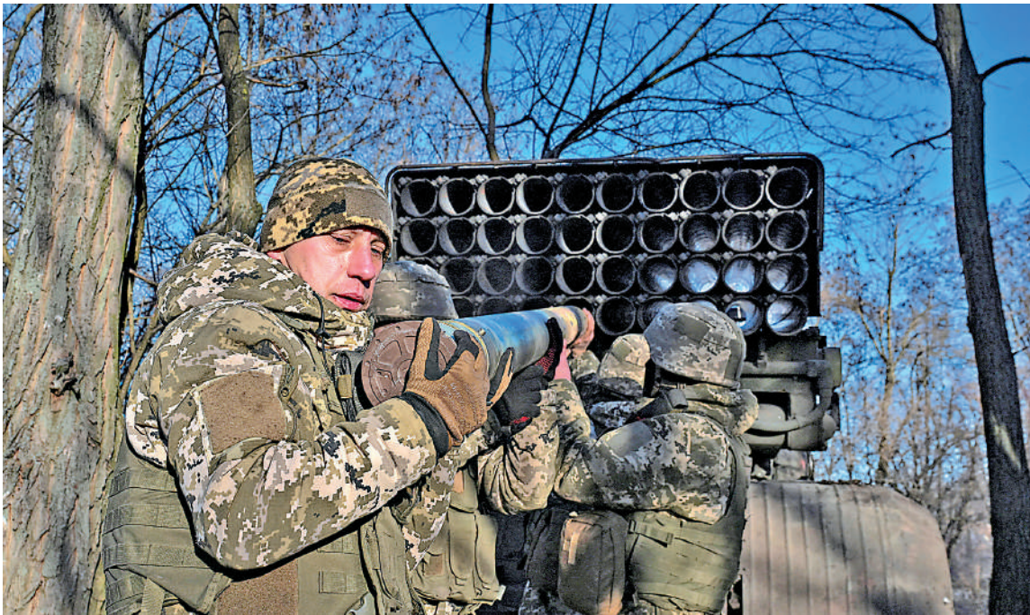
▲烏克蘭士兵25日在頓涅茨克地區準備發射火箭彈。

烏沙科夫透露，俄美正組建兩個工作組，將分別負責安全問題和經濟事務。俄總統新聞秘書佩斯科夫29日說，普京和特朗普將在近期再次進行電話會談，但普京暫無與澤連斯基通話的打算。他還表示，為了最終結束軍事衝突，烏克蘭必須從頓巴斯地區撤軍。