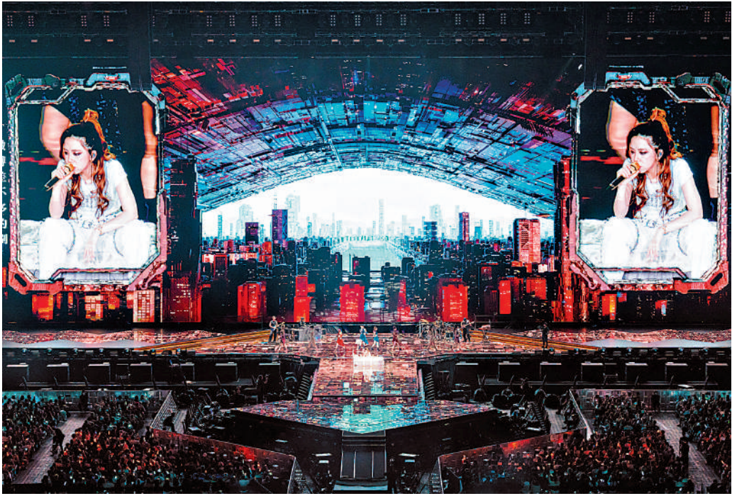
▲鄧紫棋今年8月在啟德主場館一連舉辦五場演唱會。