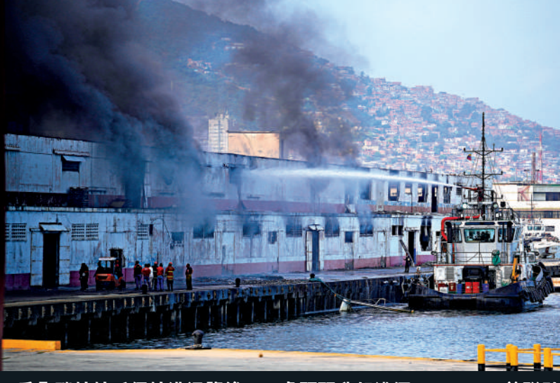
▲委內瑞拉拉瓜伊拉港遇襲後，一處碼頭升起濃煙。

美式霸權 赤裸裸呈現世人眼前 沈逸指出，事實反覆證明，所謂「規則秩序」，在霸權國家眼中，從來只是約束他國的工具，而非自我約束的準則。美對委內瑞拉的入侵，也是一記敲醒盲目崇拜西方價值觀的警鐘。沈逸表示，在現實政治中，「價值」往往服務於權力，那些被反覆宣揚的「普世價值」，在涉及霸權核心利益時，可以被迅速擱置甚至反向解釋。輕信「價值中立」或「制度萬能」，不僅是理論上的幼稚，更可能在現實中付出沉重代價。 大公報記者劉凝哲、凱雷、實習記者王美晴