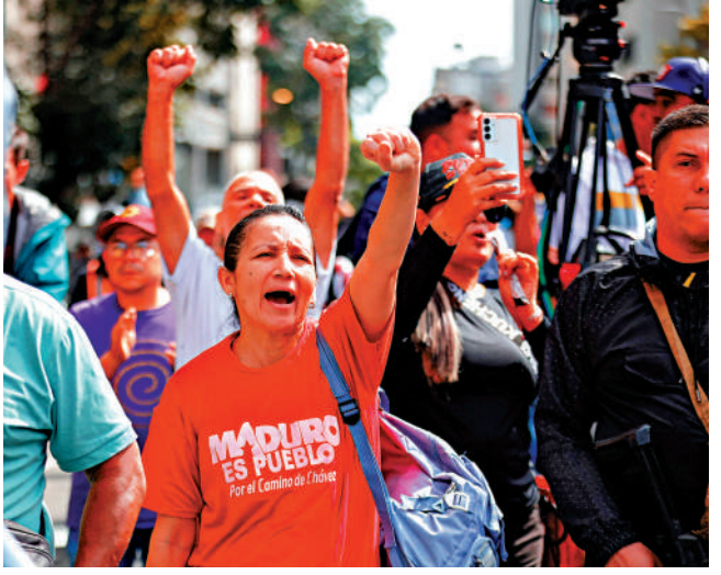
▲馬杜羅的支持者在加拉加斯街頭示威。