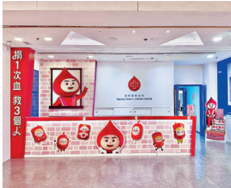
▲「Pop-up」將軍澳捐血站將於今日投入服務。