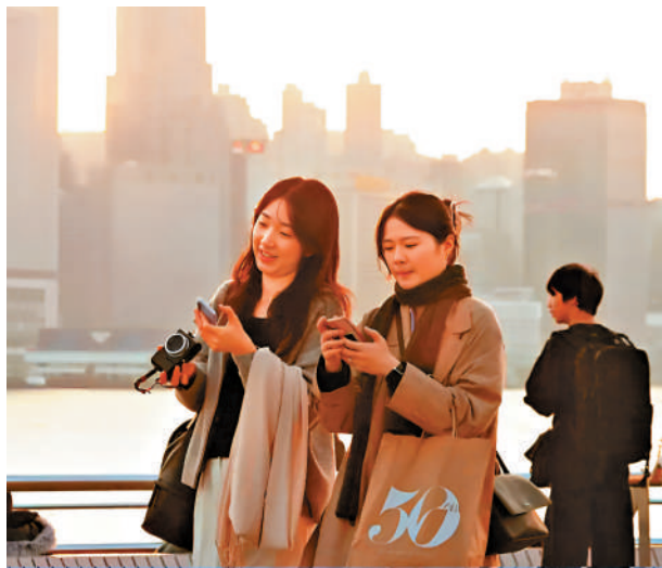
▲受強烈冬季季候風影響，天文台昨早錄得最低氣溫10.9度，是入冬以來最低紀錄。

【大公報訊】記者易曉彤報道：受強烈冬季季候風影響，天文台昨早錄得最低氣溫10.9度，是入冬以來最低紀錄。天文台昨日下午發出入冬以來首個霜凍警告，並預計今早新界內陸可能出現地面霜。網上流傳一張歐洲中期預報中心（ECMWF）的氣象預報截圖，稱本港氣溫或於一月中旬急降至1度甚至更低，引發「香港落雪」猜測。天文台表示，根據未來9日天氣預報，本港出現降雪的機會相當微。