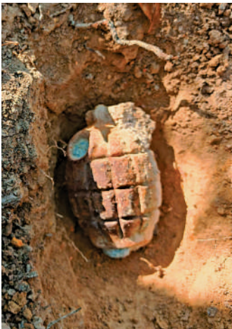
▲被發現的英軍手榴彈長約4吋，直徑約2.5吋。

彈，以至大型空投炸彈不等的常規軍火，爆炸品處理課人員根據爆炸品的性質和狀態，採用合適的方法安全引爆炸彈，例如先用大量沙包和水沙包，包圍空投炸彈周圍進行保護工作，以吸收炸藥燃燒時所釋放的熱力和氣壓。市民如有發現懷疑爆炸品，千萬不要觸摸或移動有關物品，並應即時遠離該物品及第一時間通知警方，以免令自己陷於險境。