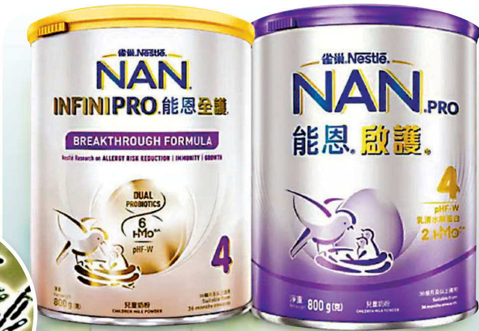
▲雀巢能恩、惠氏 ILLUMA 共二十一個批次嬰幼兒配方奶粉疑受蠟樣芽孢桿菌污染，雀巢香港正回收有關產品。