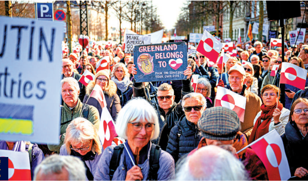
▲2025年3月，示威者手持格陵蘭旗幟在美國駐哥本哈根大使館前抗議。

● 特朗普曾於2019年、其第一任期內提議購買格陵蘭島，但丹麥與格陵蘭自治政府斷然拒絕，並稱「格陵蘭島不出售」。去年1月上任以來，特朗普多次揚言要得到格陵蘭島，並聲稱不排除動用武力的可能性。