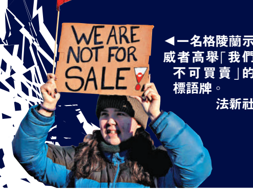
◀一名格陵蘭示威者高舉「我們不可買賣」的標語牌。