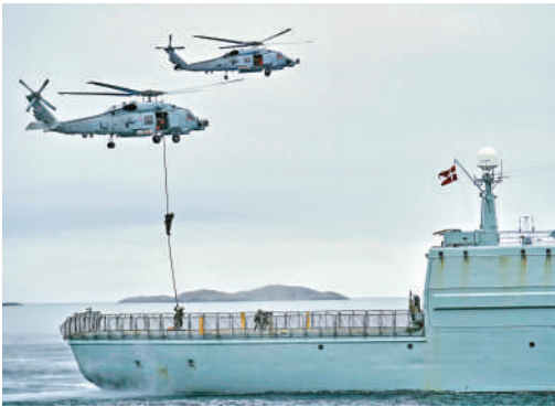
▲2025年6月，丹麥軍隊與來自多個北約歐洲成員國的部隊在北冰洋海域演習。

法國外長巴羅7日表示，美國攻擊另一個北約國家完全違背自身利益。面對美國威脅，法國「希望歐