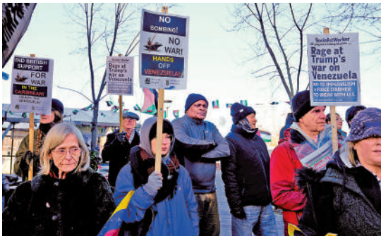
▲英國民眾3日在倫敦示威，抗議美國襲擊委內瑞拉。

一些網友猜測，BBC此次在措辭方面格外謹慎，是因為該媒體之前因惡意剪輯特朗普的講話遭到報復。BBC在2024年美國大選前夕播出一部紀錄片，故意剪輯拼接了特朗普的講話內容，被指誤導觀眾，兩名BBC高管因此事辭職。去年12月，特朗普就紀錄片風波起訴BBC，索賠100億美元。