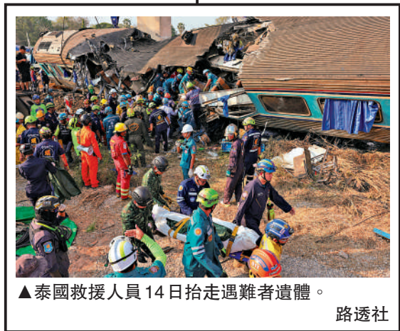
▲泰國救援人員14日抬走遇難者遺體。