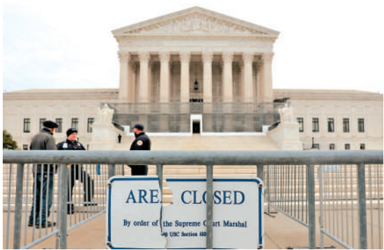
▲美國最高法院已兩度推遲公布特朗普關稅案裁決。

院。最高法院去年11月聽取口頭辯論時，9名大法官中的6人曾對關稅政策存有疑慮。但隨著最高法院本月9日和14日兩次推遲公布裁決，大法官們的立場似乎發生