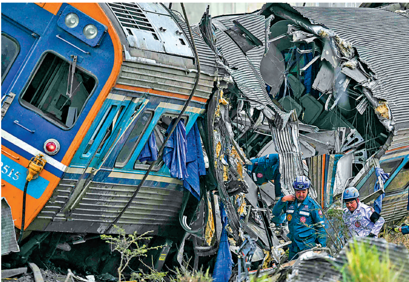
▲泰國一列車14日被起重機砸中，造成嚴重人員傷亡。