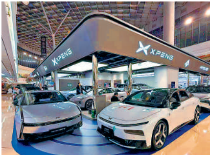
▲2025年中國汽車銷量增9.4%，再創歷史新高。