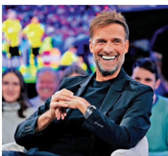
▲重投訓練的皇馬目前士氣一般，高洛普（左圖）不打算接掌帥印。