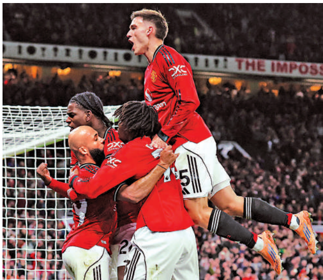
▲卡域克明言要讓曼聯重現進攻足球的「紅魔鬼基因」。