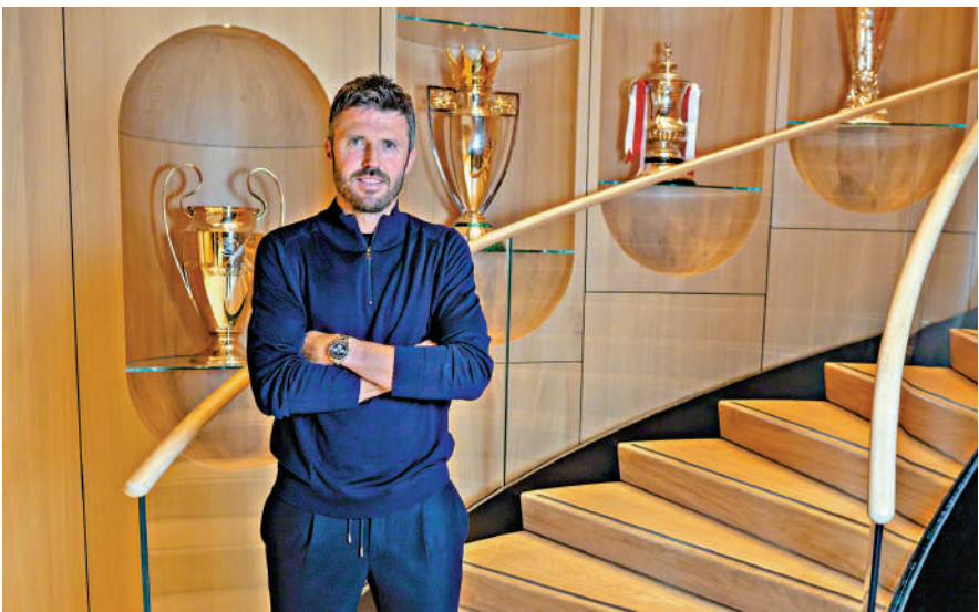
▲卡域克履新首日，重返曼聯球會總部。