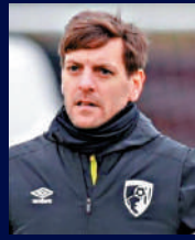
活基治 前米杜士堡助教