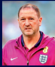
賀蘭特 前英格蘭隊助教