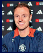
伊雲斯 前曼聯後衛