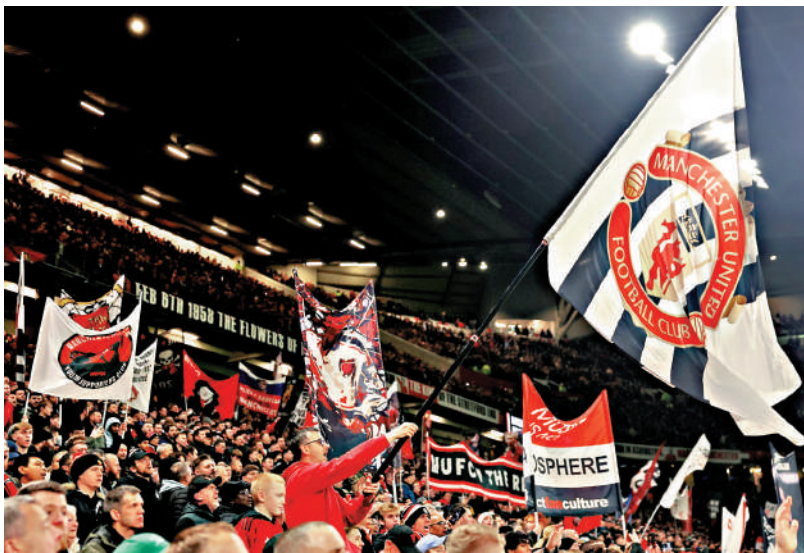
▲曼聯球迷對昔日名將卡域克期望甚高。