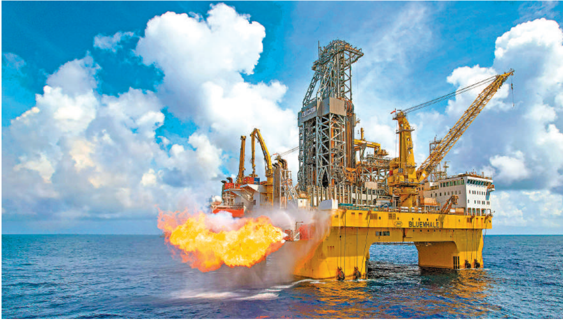
▲去年海南省海洋經濟延續高質量發展態勢，預計全年海洋生產總值達2900億元人民幣。其中深海油氣領域增儲上產成效顯著，「深海一號」氣田穩產達產。