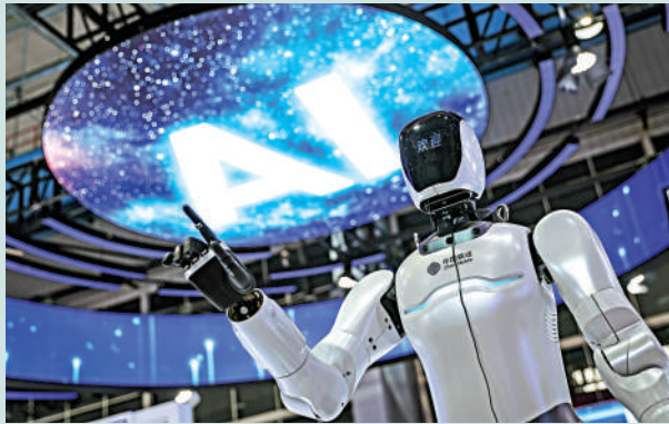
▲人工智能正驅動財務部門從傳統的「成本中心」向「業務夥伴」與「價值創造中心」戰略性演進。