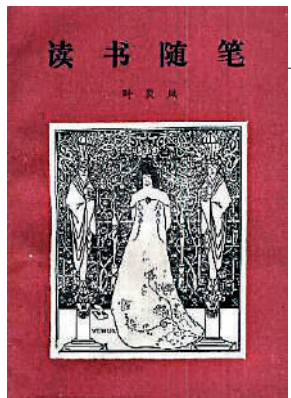
▲《讀書隨筆（一集）》，葉靈鳳著，三聯書店，1988年。