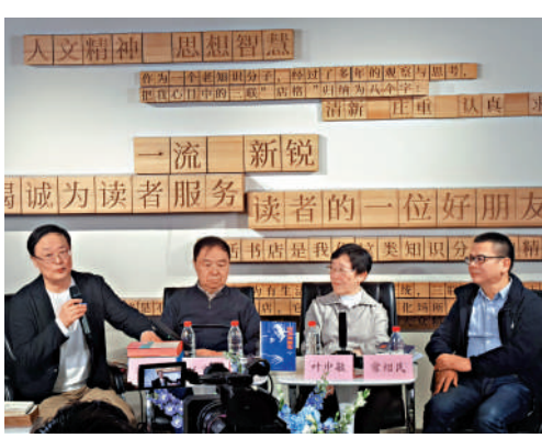
▲《葉靈鳳新傳》新書發布會現場。