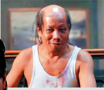
▲梁小龍在電影《功夫》中飾演「火雲邪神」。