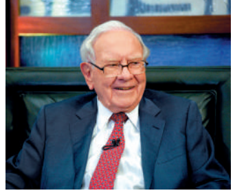
一月內卸任的巴郡行政總裁

布，他首年的年薪將達2500萬美元，比他在2024年賺取的2100萬美元高出19%，並遠超巴菲特數十年以來每年僅10萬美元的年薪。