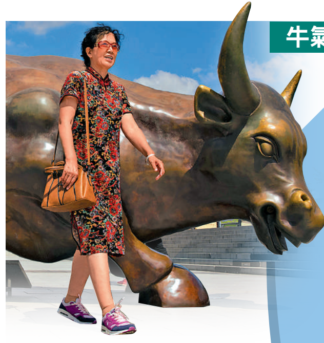
▲H股及A股市场皆未出現過熱情況，這輪升浪有望維持至農曆新年。