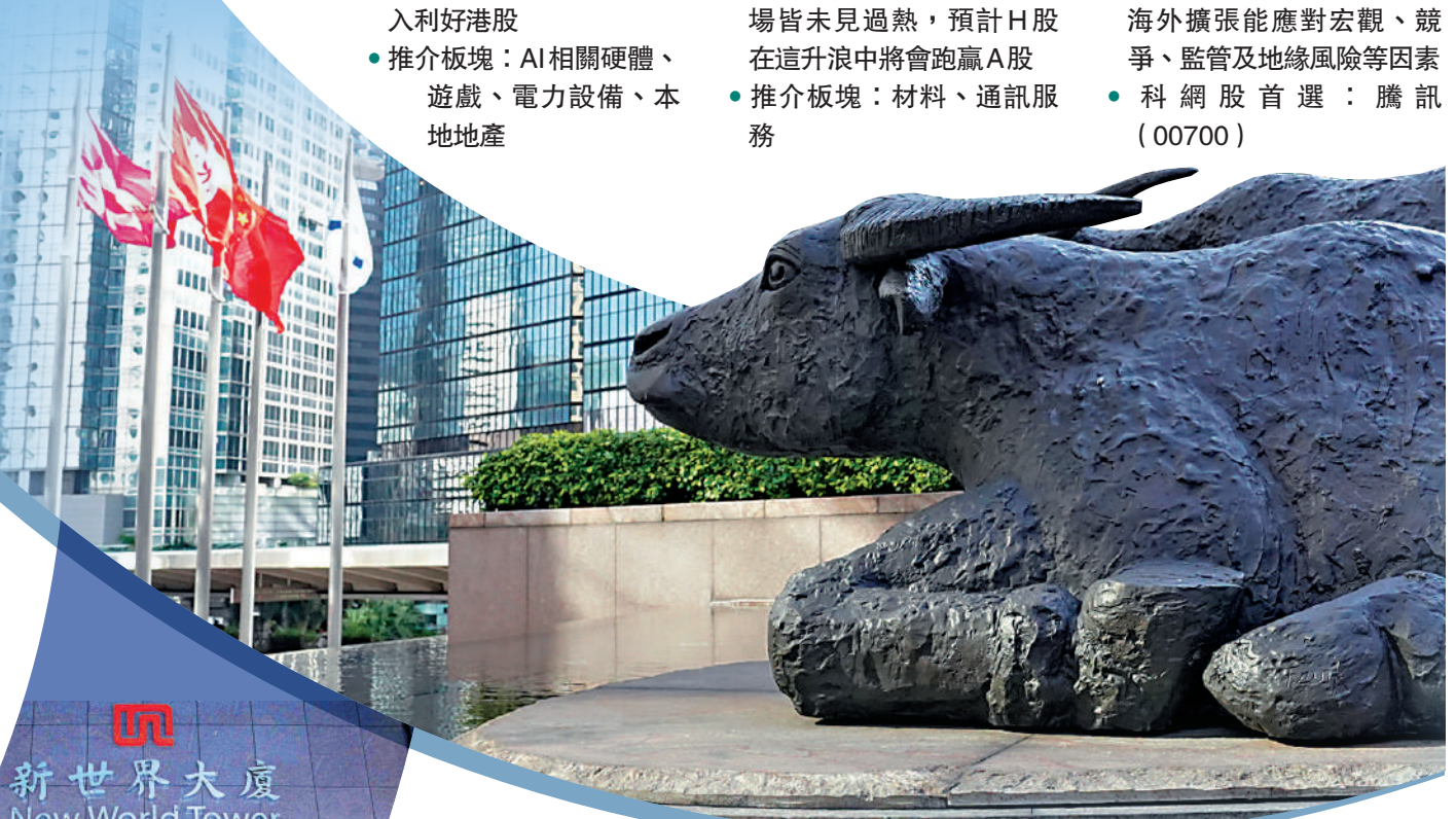
▲新世界發展的價格不單勁升，成交額也突破了10億元大關。