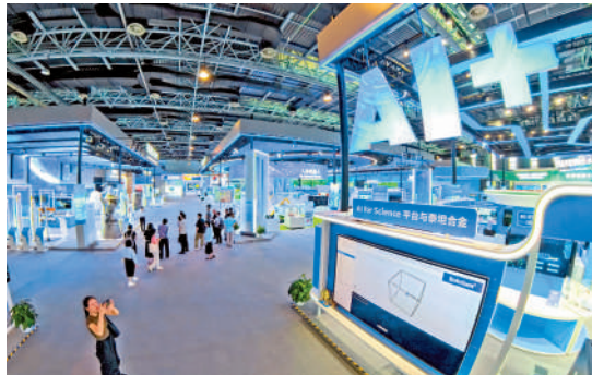
▲人工智慧企業整體呈現年輕化趨勢，是本次上榜企業平均年齡僅為12年。

從行業分布來看，算力硬件類企業共計14家上榜，較去年大幅增加9家；數據分析決策類企業有11家，同比增長4家；內容生成、視覺識別與自動駕駛領域各有8家企業入選；語音識別類則佔據3席。