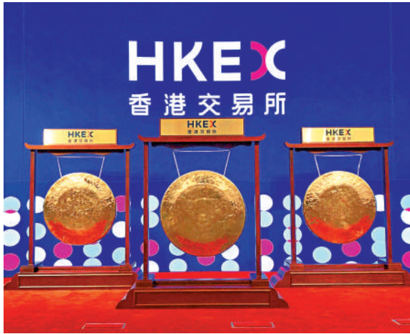
▲證券業界籲降交易成本，激活市場流動性。

該會亦指出，引入證券集體訴訟機制，並非否定現行監管體系的有效性，亦非鼓勵濫訴，而是在證監會強力執法基礎上，為投資者權利救濟增添「雙重保障」，體現法治精神的深化與市場制度的完善。此舉既能回應散戶投資者的合理期望，亦可通過提高潛在違法成本，形成有效的事前威懾，推動上市公司加強合規經營與信息披露，從而提升整體市場的誠信水平。