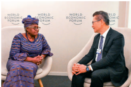
▲陳茂波於瑞士達沃斯與WTO總幹事伊維拉會面。

主義，並支持WTO因應當前面對的挑戰而進行改革，以更大的靈活性應對國際貿易中出現的新問題。