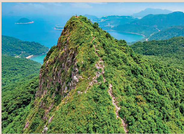
▲登上釣魚翁郊遊徑，一覽遼闊風光。

打卡釣魚翁郊遊徑。山徑橫跨了上洋山、下洋山、廟仔墩、釣魚翁、田下山部分路程，最後到達大廟。在這裏不妨欣賞一下南宋年間落成的大廟灣刻石，這亦是香港最早的有紀年的刻石，記載鹽官與友到南北佛堂門遊覽的事跡，如今被列為法定古蹟。不過，釣魚翁郊遊徑並不能登上釣魚翁，若要登山需要下山後折返至郊遊徑才能繼續前行，可根據自身情況選擇合適的登山路線。