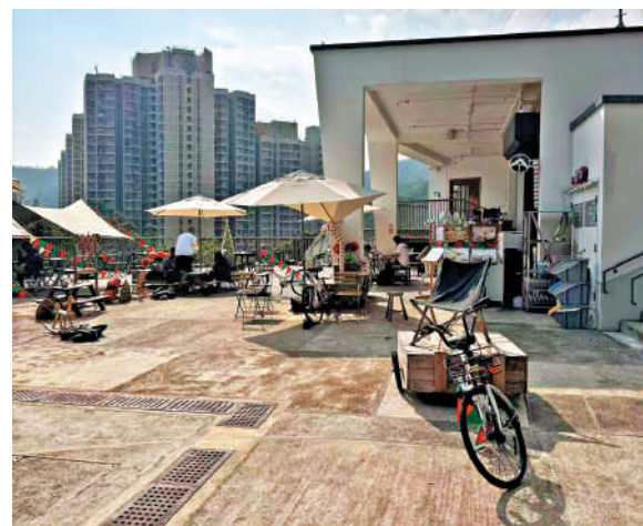
◀將軍澳風物訊有咖啡輕食供客人品嚐。

小夏威夷徑是將軍澳著名的短途行山路線，鄰近地鐵寶琳站，可欣賞瀑布和古道的風景，適合一家大小的親子遊。沿着寶琳北路步行15分鐘，路過消防局後右轉入寶康路後，一直跟着路牌走就可到達小夏威夷徑。