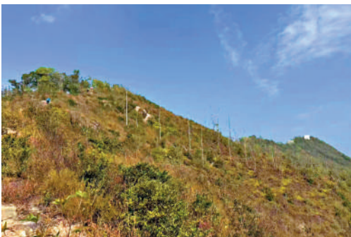
▲五桂山副峰的白色標誌牌。

從將軍澳風物訊出來，有小路可前往港鐵調景嶺站，不過下行的石階非常陡，還需要走過引水道和維修山坡的樓梯。穿過幾間學校後，即可到達港鐵站。除此之外，還可沿着寶琳南路步行，約10分鐘即可到達靈實醫院，可搭乘小巴前往港鐵寶琳站，結束一天的行山之旅。