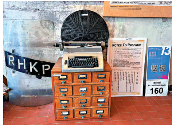
◀將軍澳風物訊內的展覽一角。

此外，大街的中段還有區內唯一的菜市場。每天早上，大街上熙熙攘攘購買所需食材，下午則非常安靜，海邊還建有一座半露天電影院「益智戲院」，晚上放映黑白電影。