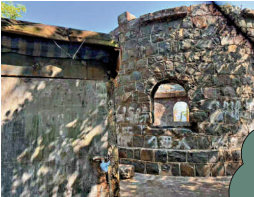
▲已經不對外開放的茅湖廢堡。

鴨仔山是將軍澳的初級行山路線之一，位於坑口及寶琳之間的魷魚灣旁。鴨仔山的入口鄰近厚德邨，高度在152.6米，整體行山難度不高。站在山頂可欣賞到吊鐘洲及牛尾海至釣魚翁一帶的景色。