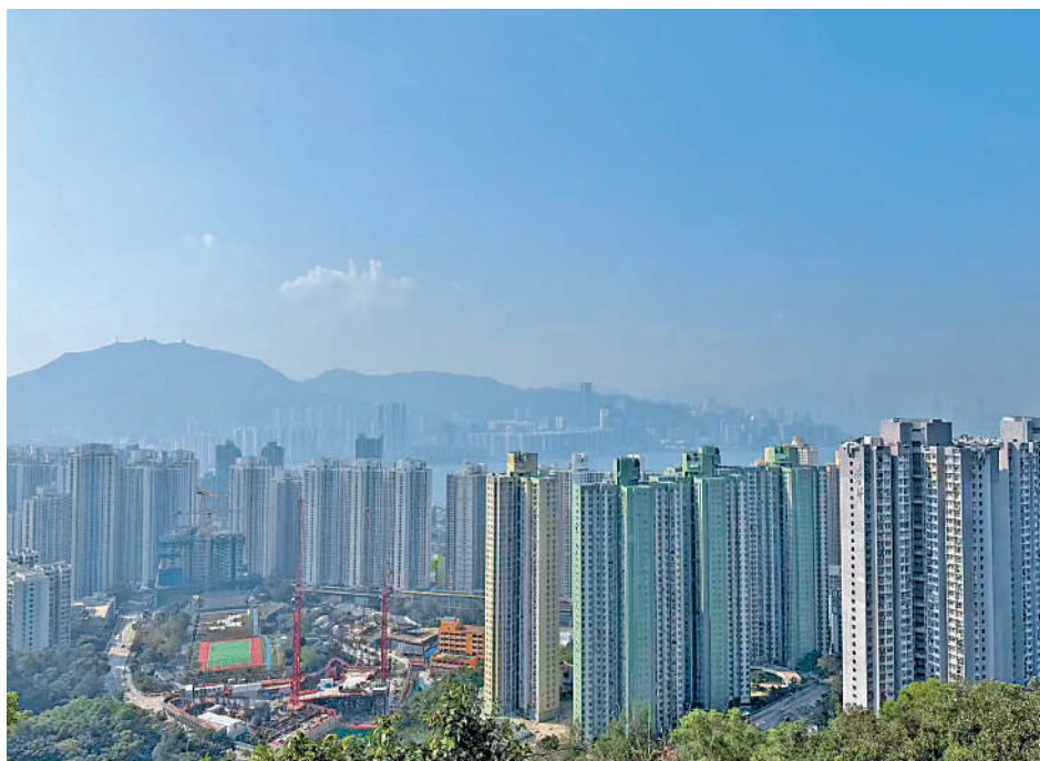
▲前往五桂山的路上可以看到藍田的住宅區。