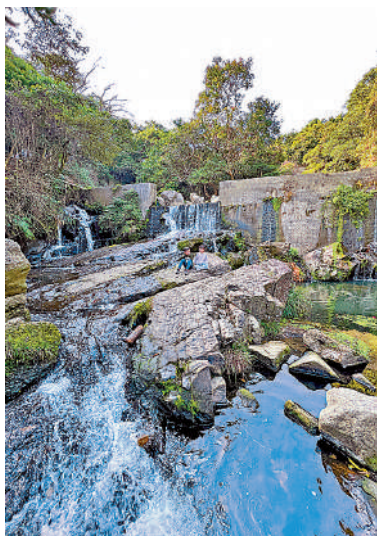
◀小夏威夷瀑布。資料圖片

小夏威夷徑的由來亦與倫尼的麵粉廠有些聯繫。麵粉廠當時在此設有儲水池，後來雖然麵粉廠結業，但這裏一度被村民改建為泳場，命名為「小夏威夷游泳場」，這來往的道路便稱為「小夏威夷徑」。