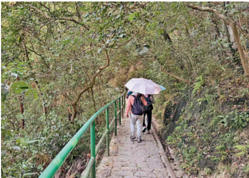
▲在藍田晨運徑行山的市民。