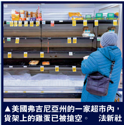
▲美國弗吉尼亞州的一家超市內，貨架上的雞蛋已被搶空。