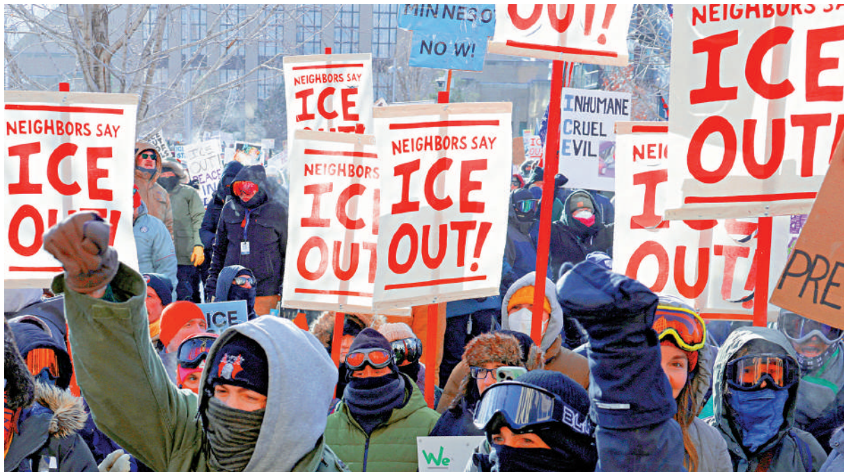
▲明尼阿波利斯民眾23日在市中心集會，高舉寫着「ICE滾出去」的標語。

美國國內持續爆發反對移民與海關執法局（ICE）特工移民執法行動的示威。5萬名明尼蘇達州民眾23日走上街頭，抗議ICE的暴力執法行動，700多家商戶當天關門歇業聲援。這是該州迄今為止針對特朗普政府移民行動的最大規模抗議活動，部分示威者與警方發生激烈衝突，逾百人被捕，一名51歲的男子死亡。明尼蘇達州總檢察長埃利森指控說，特朗普政府已將移民執法變成「政治報復手段」。