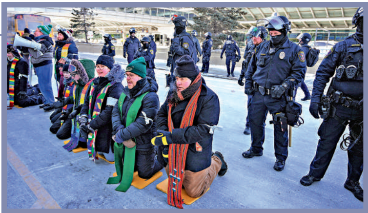
▲23日上午，大批宗教人士在明尼阿波利斯聖保羅國際機場靜坐，路過警察全副武裝的警察。

特朗普政府自去年12月起在明尼蘇達州展開大規模針對非法移民的執法行動，引發當地民眾強烈不滿。截至23日，美政府已調遣近