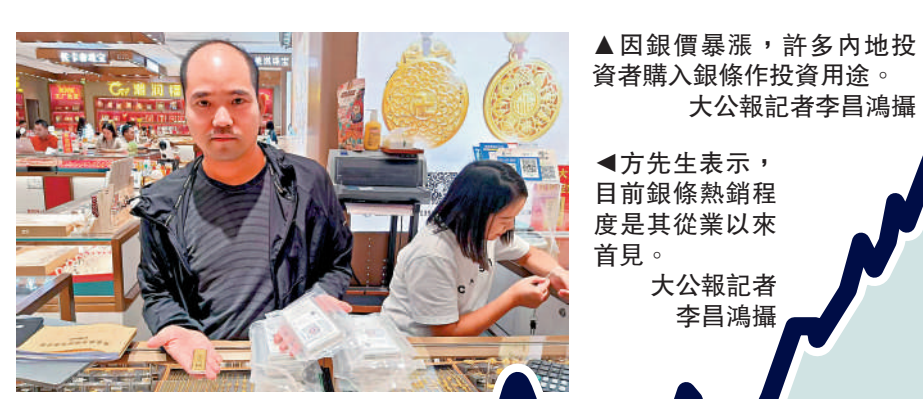
▲因銀價暴漲，許多內地投資者購入銀條作投資用途。大公報記者李昌鴻攝 ◀方先生表示，目前銀條熱銷程度是其從業以來首見。大公報記者李昌鴻攝