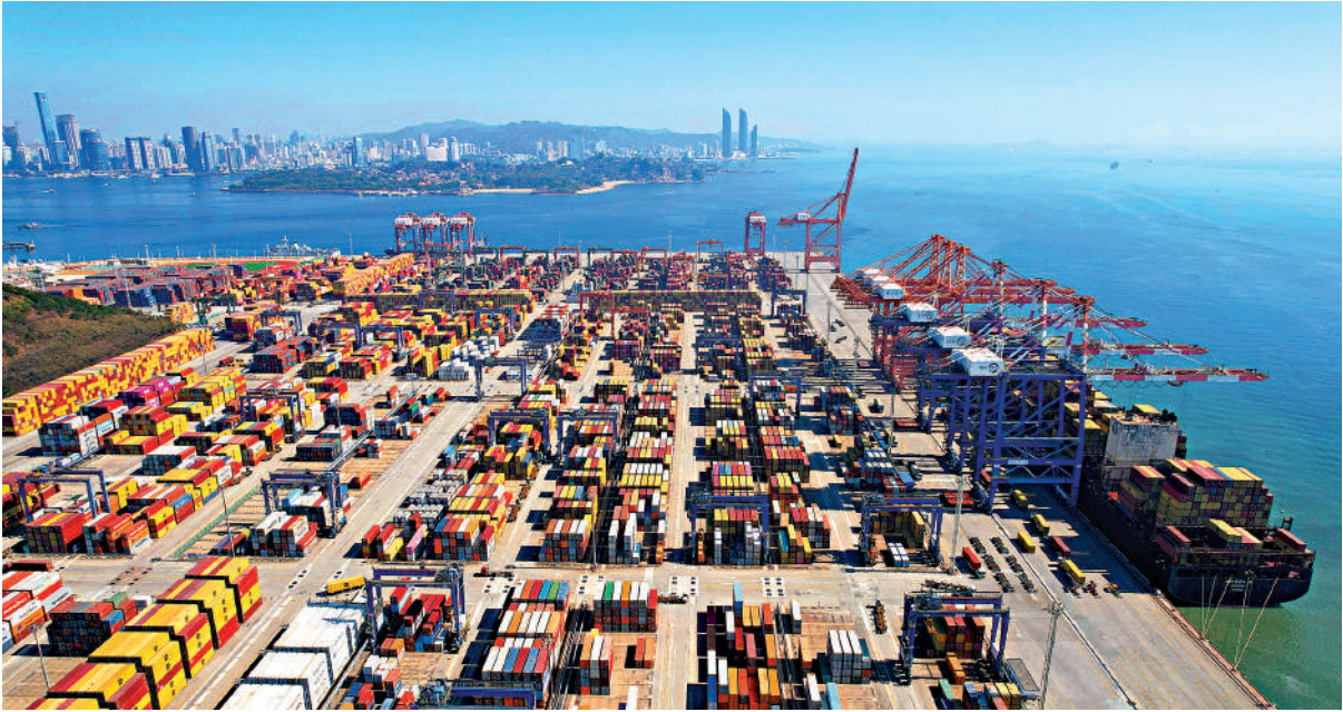
▲中國「強出口」格局預期在「十五五」時期延續，一是歐美以外市場出口規模將繼續擴大，二是中間品出口佔比將持續提升。