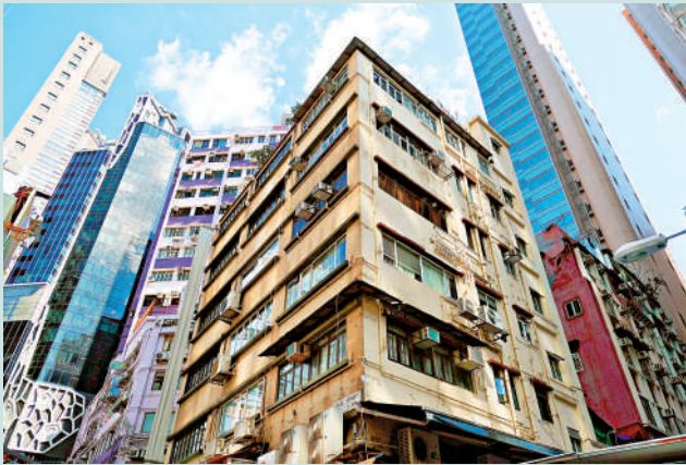
▲唐樓一般樓高五至六層，不設電梯，雖然樓齡舊，但單位勝在實用率高，售價相宜。