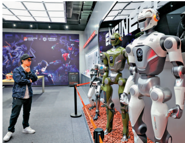
▲1月15日，在深圳市福田區深業上城的眾擎機器人門店，顧客參觀具身機器人。

人才吸納、應用場景開發等關鍵環節，以科技創新驅動產業升級，助力廣東高質量發展。他表示，AI應用場景多元，對人才的複合能力要求高，目前可見的規模化應用成果還不夠多。他建議，應加大力度推動AI技術與具體產業場景的深度融合，加速從技術儲備到現實生產力的轉化。