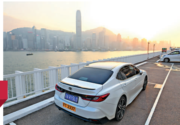
▲經「粵車南下」的粵A牌照私家車停在香港尖沙咀一個停車場。

廣東省十四屆人大五次會議26日在廣州開幕，廣東省政府工作報告在總結粵港澳大灣區五年來建設成果時指出，在交通互聯互通方面，「港車北上」、「澳車北上」、「粵車南下」累計832萬輛次，港珠澳大橋車流量屢創新高，主要城市間基本實現1小時通達。香港特區政府運