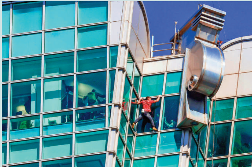
▲▲▼美國極限攀岩專家霍諾德日前徒手獨攀台北101大樓，順利攻頂。資料圖片