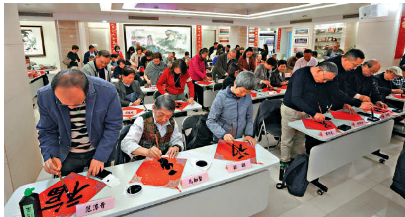
▲一眾書法家及書法愛好者即席揮毫。

另外，燈會將在運營期間推出面向港澳團隊的優惠政策，10人起憑相關證件可享受旅行社團隊優惠，詳情可諮詢當地旅行社。