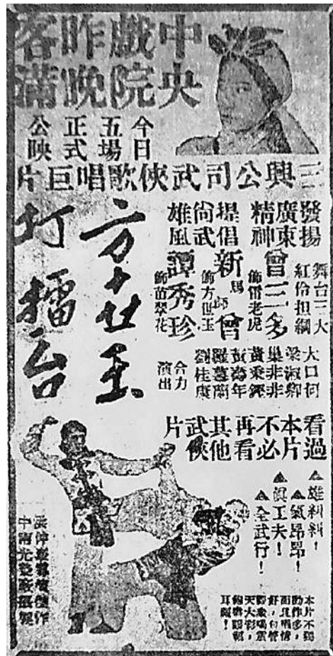
▲1938年的《方世玉打擂台》是全世界第一部有「武術指導」職位的電影。

而袁和平和他的袁家班就是武術指導走向世界的關鍵人物。1999年應荷里活之邀，袁和平為《黑客帝國》系列設計動作，引起全球轟動。而後由其作為動作設計的電影《卧虎藏龍》成為全球現象級電影，之後袁和平不僅為《黑客帝國2》《黑客帝國3》繼續擔任動作設計，也成為昆汀·塔倫迪諾的代表作《殺死比爾》的動作設計，「動作設計」漸成為全球電影工業中的重要部分。