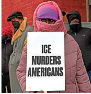
▲明尼阿波利斯民眾舉着「ICE謀殺美國人」的標語以示抗議。