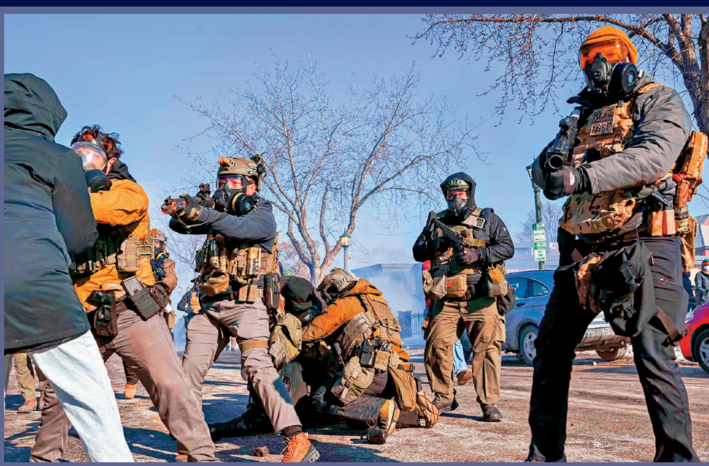
▲在明尼阿波利斯反ICE示威中，一名民眾被聯邦執法人員按倒在地。

美國移民與海關執法局（ICE）的暴力執法行動引發眾怒，路透社的最新民調顯示，美國總統特朗普在移民問題上的支持率已降至其本屆任期以來的最低水平，多數受訪者認為其政府在移民執法方面「過火」。ICE的行動同樣引起其他國關注。據報ICE特工下月將協助意大利冬季奧運相關的安保工作，引發意大利方面的不滿，米蘭市長對此明確表態，不歡迎ICE人員到來。