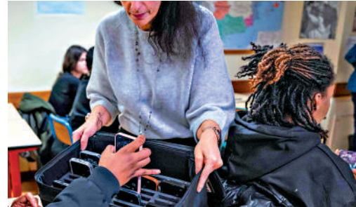
▲法國國民議會通過禁止15歲以下青少年使用社交媒體的法案。圖為法國一所高中在上課前收走學生手機。

【大公報訊】綜合路透社、BBC報道：法國國民議會（眾議院）在26日至27日的通宵會議中通過一項法案，將禁止15歲以下