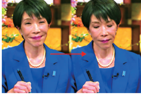
▲高市早苗在26日的一場眾議院選舉辯論中，被問及黑金醜聞時瞬間變臉。

【大公報訊】綜合NHK、日本經濟新聞報道：日本政府27日發布眾議院選舉公告，投票和計票將於2月8日舉行，正式拉開12天的選戰序幕。日本首相高市早苗在26日的