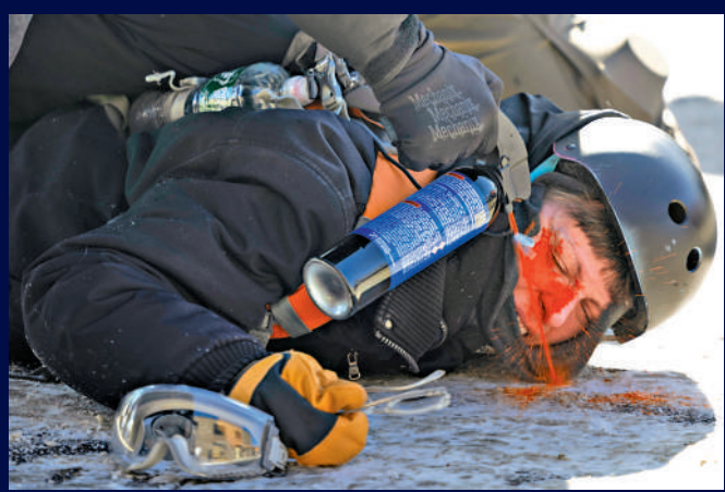
▲一名明尼阿波利斯示威者遭執法人員近距離噴射胡椒噴霧。

美國移民與海關執法局（ICE）的暴力執法行動引發眾怒，路透社的最新民調顯示，美國總統特朗普在移民問題上的支持率已降至其本屆任期以來的最低水平，多數受訪者認為其政府在移民執法方面「過火」。ICE的行動同樣引起其他國關注。據報ICE特工下月將協助意大利冬季奧運相關的安保工作，引發意大利方面的不滿，米蘭市長對此明確表態，不歡迎ICE人員到來。