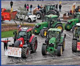
▲「南共市」成員國在法國巴黎舉行抗議活動，抗議美國對其產品加徵關稅。

除印度外，歐盟近年積極與英國、南方共同市場、墨西哥等國家及地區達成貿易協議。1月17日，歐盟與南方共同市場（包括巴西、阿根廷、巴拉圭、烏拉圭與玻利維亞）簽署貿易協議。雙方將取消雙邊貿易中超過90%的商品關稅。這將為歐洲的汽車、機械、葡萄酒以及南共市國家的肉、糖、大米、大豆等商品進入對方市場提供便利。