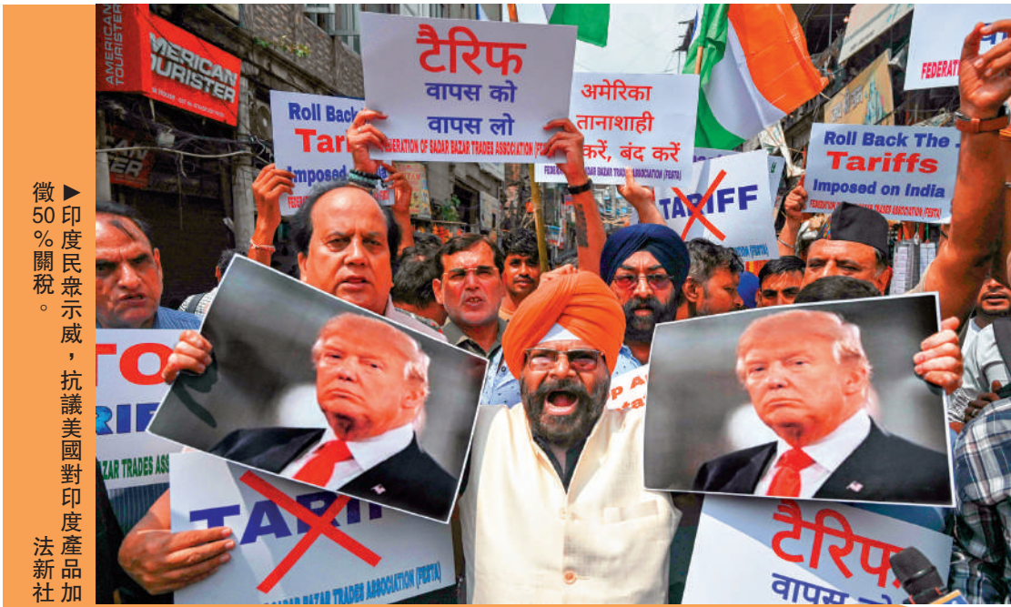
印度民眾示威，抗議美國對印度產品加徵50%關稅。