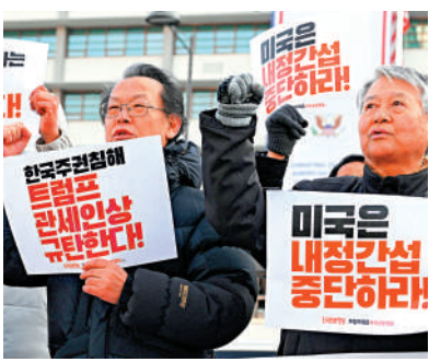
▲韓國民眾27日舉行抗議活動，抗議美國對其產品加徵關稅。

分析人士認為，特朗普突然對韓國發出關稅威脅，可能是想藉機向美國最高法院施壓，阻止其作出不利於特朗普政府的裁決。韓國漢陽大學經濟學教授金光錫指出，特朗普似乎擔心，最高法院可能推翻他的關稅，從而導致韓國等國家縮減投資承諾，「他是在暗示，最高法院不應作出對美國經濟產生不利影響的裁決」。