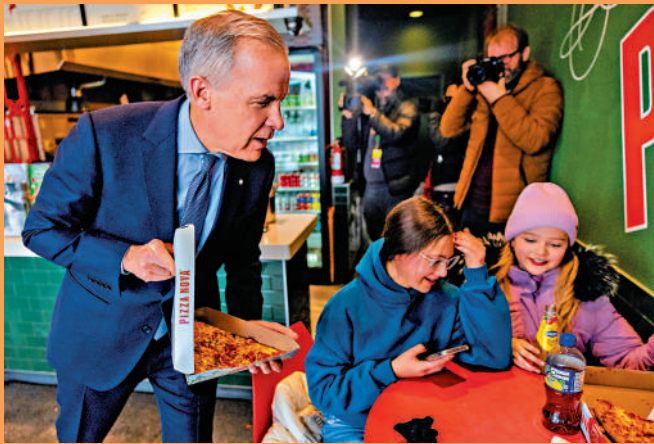
▲加拿大總理卡尼（左）在多倫多一間本土品牌披薩店和兒童聊天。