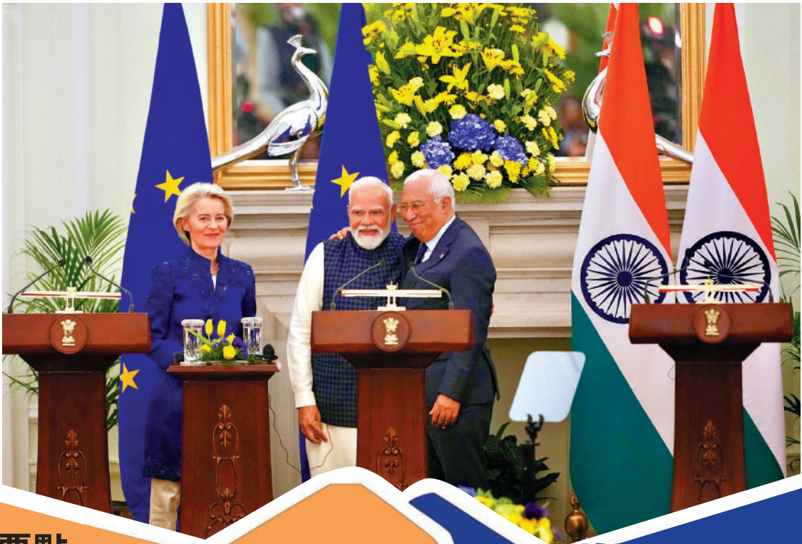
歐盟委員會主席馮德萊恩（左）、印度總理莫迪（中）、歐洲理事會主席科斯塔27日慶祝印歐達成貿易協議。