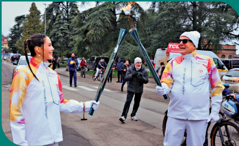
▲谷愛凌（左）日前參與米蘭冬奧火炬傳遞。