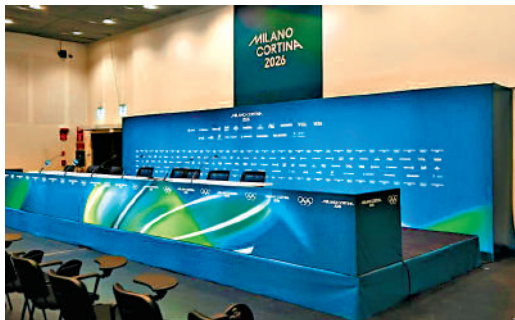
▲冬奧主媒體中心位於米蘭市安聯會展中心。

個工位、兩間可容納200人的新聞發布廳，並提供高速網絡、賽事直播信號等全方位服務。國際廣播中心則作為奧運主轉播商奧林匹克轉播服務公司及各持權轉播機構的運營基地，配備了從小型工作間到大型製作控制室、演播室、評論席等多樣化的專業設施。