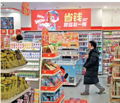
▲鳴鳴很忙昨日首掛受捧，收市價較招股價大升69.1%。

今日截飛的內地能量飲料商東鵬飲料（09980）昨日獲券商借出226.05億元开展資金，超額認購21.3倍。其中，富途證券借出的开展