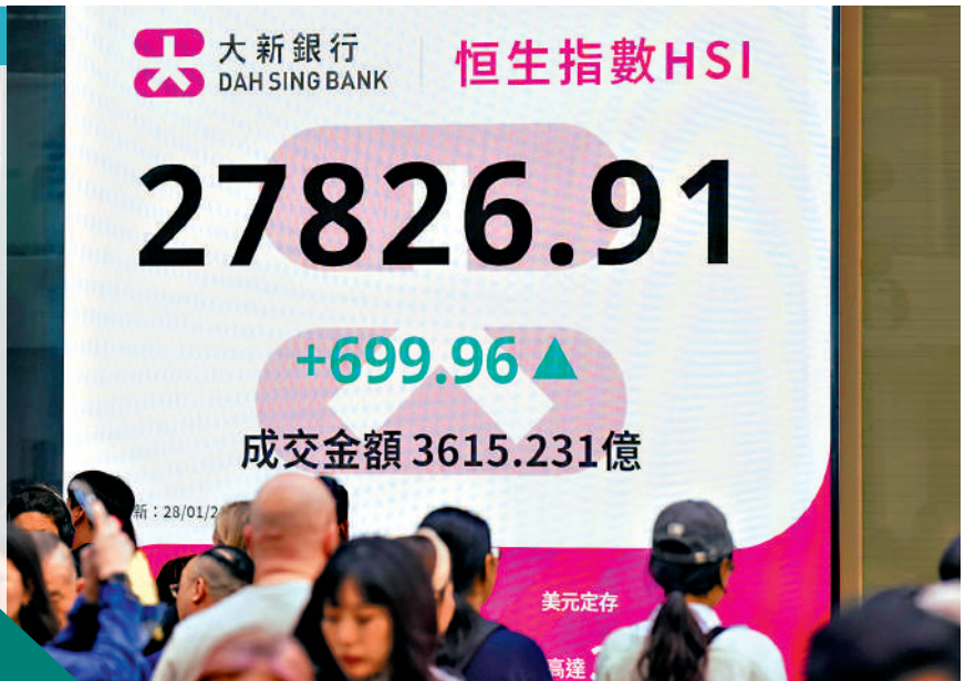
▲恒指昨日收市升699點或2.5%，跑贏亞太區市場。