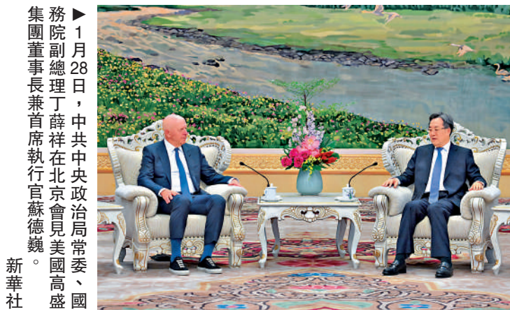
▲1月28日，中共中央政治局常委、國務院副總理丁薛祥在北京會見美國高盛集團董事長兼首席執行官蘇德巍。

【大公報訊】據新華社北京1月28日電，中共中央政治局常委、國務院副總理丁薛祥28日在北京會見美國高盛集團董事長兼首席執行官蘇德巍。