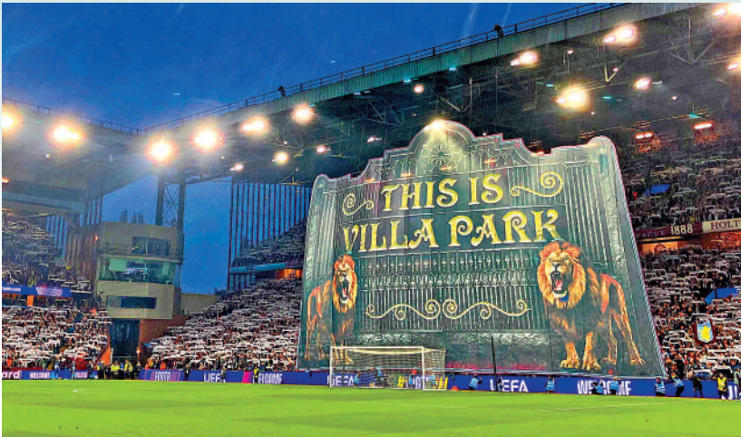
◀維拉主場氣勢堪比英超「Big 6」球隊。