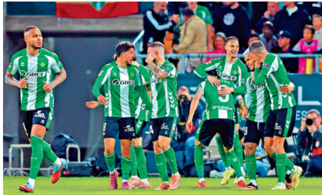
▲▼貝迪斯（綠白衫）及波圖（藍白衫）首階段最後一場，分途出戰飛燕諾及格拉斯哥流浪。