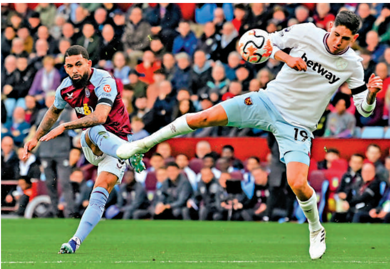
◀雷斯（左）過去在維拉效力時，已經肩負中場組織工作。