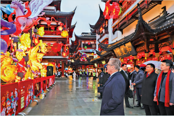
▲1月30日，英國首相斯塔默在上海豫園欣賞主題花燈。

NBC援引法國巴黎亞洲中心學者讓一皮埃爾·卡貝斯坦的話指出，在美國政策不確定性不斷上升的全球環境中，各國正以更加現實和務實的態度看待中國。《華爾街日報》報道認為，斯塔默此次訪華，是美國二戰後盟友在全球範圍內尋找新機遇的最新例證，其目的在於對沖與華盛頓在貿易和外交關係上的不確定性。