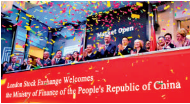
▲去年中國在倫敦首度發行人民幣綠色主權債券。

中英經濟財金對話是中英之間三大高級別對話與合作機制之一（其他兩個對話機制分別為戰略對話和高級別人文交流機制），於2008年正式建立，是中英之間就經濟財金領域戰略性、全局性、長期性重大問題開展對話合作的重要平台。機制建立後，中英雙方分別在2009年5月、2010年11月、2011年9月、2013年10月、2014年9月、2015年9月、2016年11月、2017年12月、2019年6月和