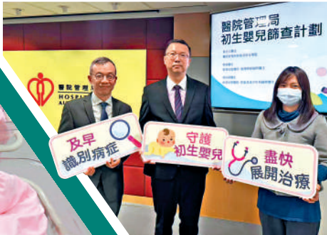
▲政府期望所有私家醫院參與篩查計劃。