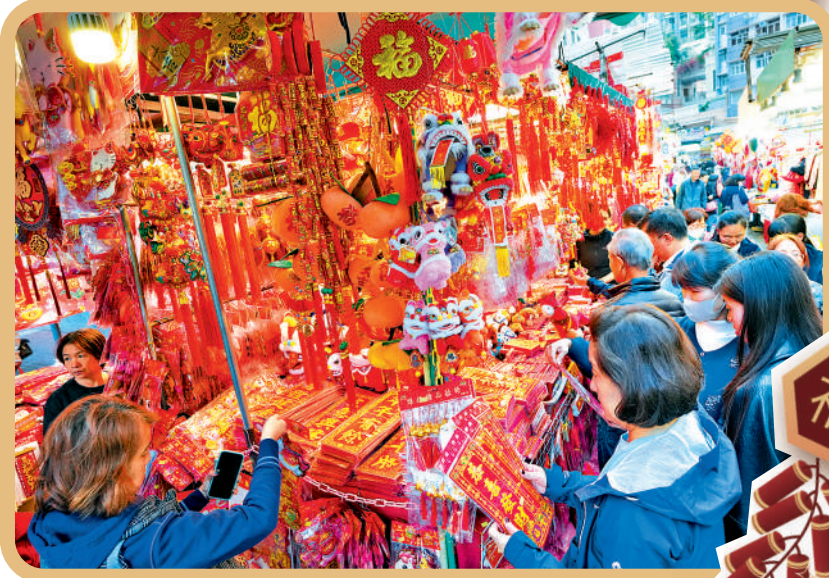
▲市民購買揮春迎馬年。

停車場營辦商會預早於停車場內張貼告示，通知駕駛者有關的收費調整。其中私家車、的士、客貨車，時租加1元、日泊加10元、夜泊加5元、月租加150元；旅遊巴士及貨車，時租加1元、夜泊加5元；電單車方面，日泊加2元、夜泊加1元、月租加60元。季租皆按月租加幅上調。另外，為配合季租周期，林士街、天后、筲箕灣、香港仔、葵芳及荃灣停車場季租新收費4月1日生效。