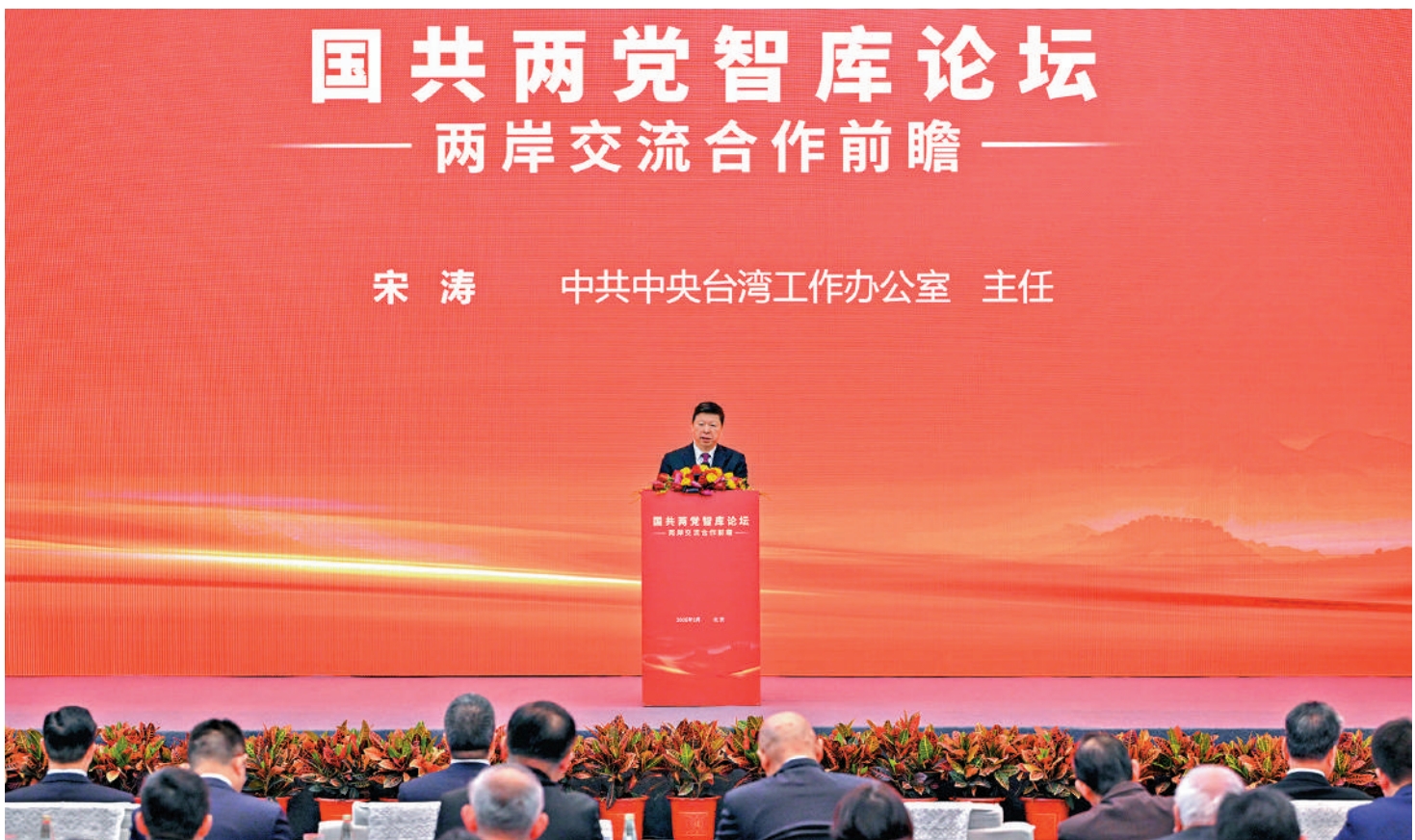
▲國共兩黨智庫論壇3日在北京開幕。圖為中共中央台辦主任宋濤致辭。

與會人士經過深入交流討論，提出五個方面15條共同意見。一、推動恢復兩岸人員往來正常化，包括推動解除民進黨當局對兩岸人員往來的人為限制、盡快全面恢復兩岸海空客運直航正常化、深化兩岸觀光旅遊交流合作等。二、加強兩岸新興產業領域合作，推動兩岸企業、研究機構、行業組織加強交流，促進兩岸精密機械、智能製造技術交流、人才培訓與產業合作，開展聯合技術攻關和成果互享，促進兩岸在技術創新與標準互認方面達成更多共識。三、探索兩岸醫療康養合作新路徑，推動兩岸醫療衛生界交流合作、整合兩岸中醫藥資源與技術、深化兩岸康養交流合作。四、深化兩岸環保領域交流合作，支持兩岸企業、研究機構、民間組織等在清潔能源、生態修復、固廢資源化利用等領域加強交流協作，共同提升產業競爭優勢。五、強化兩岸防災減災合作，圍繞洪水控制、洪水利用、洪水塑造及數字孿生水利、海綿城市建設、山洪災害防治等，開展交流合作。