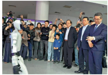
▲中國國民黨副主席蕭旭岑一行4日在北京到訪清華大學，現場觀看了精彩的機器人表演。

眾發聲，建立起一個溝通平台，包含觀光、旅遊、醫療、防災等重要領域。 蕭旭岑指出，綠營有一些人不樂見到這樣的成果，所以酸言酸語，但這樣的政策宣布代表我們跟大陸建立起一個互信有效的平台。 蕭旭岑一行4日下午到訪清華大學，現場觀看了精彩的機器人表演。參觀結束後，中國國民黨國政研究基金會副董事長李鴻源表示，此行的核心就是兩個字「務實」，兩岸要和平。此次很多台灣的專家學者希望兩岸能在科研方面結合，進一步落實在產業方面。