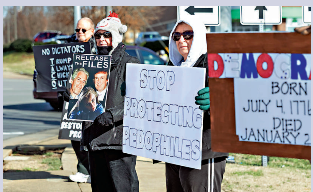
▲美國民眾1月17日在肯塔基州示威，要求特朗普公布愛潑斯坦案真相。