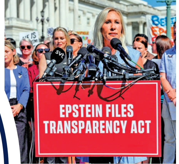
▲格林主張盡快公布所有愛潑斯坦文件，因此與特朗普發生衝突。

【大公報訊】據《國會山報》報道：美國前聯邦眾議員格林日前接受採訪時批評說，總統特朗普的「讓美國再次偉大」（MAGA）口號是「謊言」。格林曾是特朗普的堅定支持者，但特朗普重返白宮以來，雙方在公布愛潑斯坦文件、應對巴以衝突等議題上分歧擴大，最終分道揚鑣。格林說，特朗普為大金主而非美國人民服務。 格林說，美國人民意識到MAGA是一個謊言，特朗普政府真正服務的對象是「持續向總統的政治行動委員會捐款、贊助美國獨立250周年活動和那座（白宮）大型宴會廳的超級大金主」。她指出，這些大金主獲得了政府合約和特赦等「特殊的好處」。她還批評特朗普偏袒富裕盟友，將施政重心放在外交政策而非美國國內問題上。格林稱，加沙地帶正在發生的戰爭是為了以色列的利益，「數十萬無辜民眾被殺害，只是為了在那裏推進房地產開發計劃」。 格林去年11月與特朗普決裂後辭去眾議員職務。本月2日，格林發聲支持另一名與特朗普關係不和的共和黨籍聯邦眾議員馬西。馬西因要求公開所有愛潑斯坦文件被特朗普記恨。特朗普2日稱，馬西因為「左翼」新婚妻子而變成「自由派」。格林在社交媒體發文稱，特朗普應該去關心選民，而不是攻擊同為共和黨人的馬西夫婦。