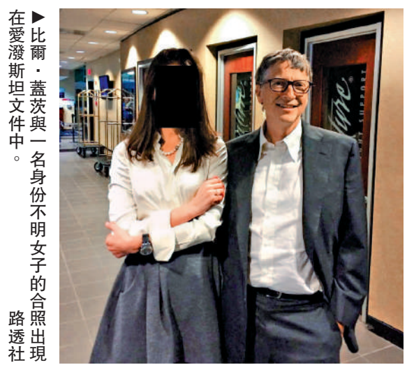
在愛潑斯坦文件中，比爾·蓋茨與一名身份不明女子的合照出現

愛潑斯坦案亦震動英國政壇，英國警方3日對英國前駐美大使曼德爾森啟動刑事調查。最新文件顯示，2003年至2004年，曼德爾森及其伴侶曾收受來自愛潑斯坦的7.5萬美元轉賬；2009年擔任英國商務大臣期間，曼德爾森曾將寫給時任首相布朗的經濟簡報轉發給愛潑斯坦；2010年，他還提前向愛潑斯坦透露歐盟退出5000億歐元的歐元區救助計劃。曼德爾森1日宣布退出英國工黨，3日辭去上議院終身議員職務。 英國首相斯塔默4日稱，他後悔任命曼德爾森為駐美大使，並批評曼德爾森「背叛國家」及「多次撒謊」。 YouGov最新民調顯示，多數美國民眾對特朗普的經濟、移民等政策不滿。愛潑斯坦案對特朗普及共和黨造成更多負面影響，特朗普政府被批評試圖掩蓋真相。美司法部在公布最新文件時又意外曝光近100名受害者名字和個人信息，不得不緊急撤下數千份文件，再次引發眾怒。特朗普不止一次表示，他擔心共和黨在今年11月中期選舉中落敗，失去國會控制權。（綜合報道）