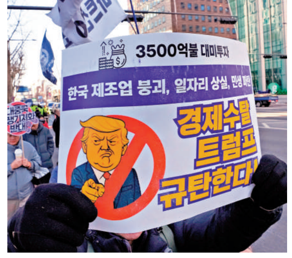
▲韓國民眾1月31日在首爾示威，抗議特朗普的關稅政策。

【大公報訊】據韓聯社報道：韓國產業通商部通商交涉本部長呂翰九3日表示，就他所知，美國政府各部門正就正式公布上調對韓關稅進行協商。美國總統特朗普日前突然宣布將把韓國輸美汽車、木材、藥品等商品的關稅稅率從15%上調至25%，理由是韓方仍未批准包含對美投資3500億美元條款的貿易協議。韓國官員近日接連訪美，但未能說服特朗普政府改變主意。 呂翰九3日結束與美方的關稅問題磋商。他表示，在與美國貿易副代表會晤時，他重點說明了韓方落實對美投資項目和涉非關稅領域協議的立場與意願，並指出已取得進展，但由於美方「尚未完全理解兩國在體系上的不同之處」，韓方有必要繼續與美方接觸溝通。他透露，美國政府各部門之間正就正式公布上調對韓關稅進行協商。韓媒稱，美國政府即將在聯邦公報上刊登上調關稅的通告，通告草稿已經完成。 韓國外長趙顯3日與美國國務卿魯比奧舉行會談。趙顯訪美前表示，韓國正在推進韓美貿易協議相關立法，將向美方說明並尋求諒解。韓媒稱，韓國計劃在2月底至3月初處理《對美投資特別法》。美國國務院3日稱，美韓同意在民用核能、核潛艇、造船、韓方增加對美關鍵產業投資等議題上保持合作。