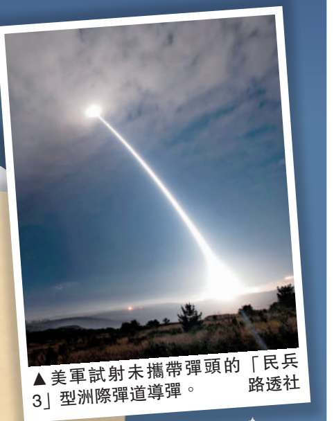
▲美軍試射未攜帶彈頭的「民兵3」型洲際彈道導彈。

Q 條約失效後各方反應？ ●聯合國秘書長古特雷斯：該條約失效對於國際和平與安全而言是一個嚴峻時刻，敦促美俄兩國立即重返談判桌，就新的後續框架達成一致。 ●中國：對該條約到期失效表示遺憾，呼籲美方以負責任方式處理條約的后續安排，早日恢復同俄戰略穩定對話。 ●俄羅斯：克里姆林宮稱，俄方將繼續以負責任態度維護戰略核穩定。 ●美國：白宮表示，特朗普將決定美國核軍控問題的后續走向，且會「按照自己的時間安排闡明相關立場」。