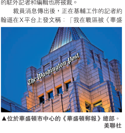
▲位於華盛頓市中心的《華盛頓郵報》總部。

【大公報訊】綜合《紐約時報》、《華盛頓郵報》報道：美國億萬富豪貝佐斯旗下的《華盛頓郵報》4日宣布裁員。知情人士透露，《華郵》此次裁員人數約佔員工總數的30%，包括新聞編輯部約800名記者中的300多人。 分析指，貝佐斯在2024年總統大選期間決定撤回《華郵》對民主黨總統候選人哈里斯的背書，並要求報社評論版的立場轉趨保守，是導致訂閱用戶大量流失的主要原因之一。 《華郵》總編輯默里4日告訴員工，將取消報紙的體育和圖書版、縮減美國本地新聞版，停播每日新聞播客；解僱國際新聞版所有專職攝影師，在亞洲、中東、澳洲等多個地區的駐外記者和編輯也將被裁。