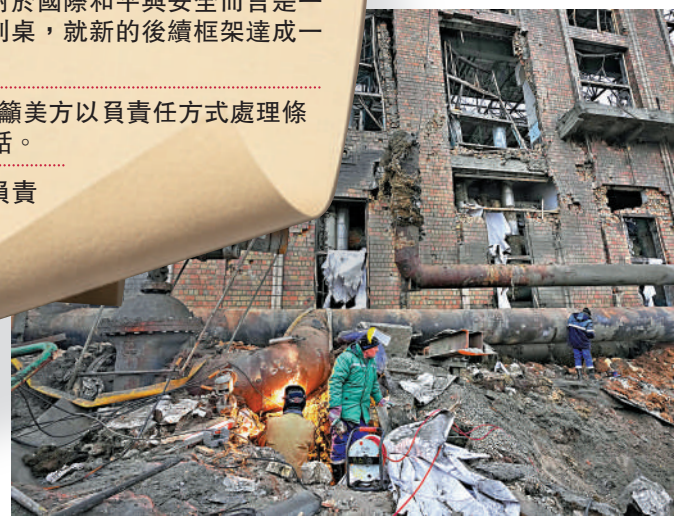
►美俄烏三方5日的會談未解決領土分歧。圖為基輔一間火力發電廠4日遭俄軍空襲受損。