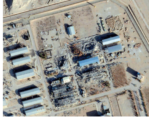
▲衛星圖片顯示，伊朗伊斯法罕核設施已重新修繕。核

【大公報訊】綜合Axios新聞網、新華社報道：伊朗和美國官員4日先後確認，兩國將於6日在阿曼首都馬斯喀特舉行談判。雙方此前就談判地點的選定經歷了一番波折，最終在至少9個中東國家的緊急游說下，避免談判破裂。然而，談判議程仍舊存在分歧：伊朗堅持談判範圍限於核問題，但美國堅稱談判內容還必須包括伊朗的彈道導彈計劃。 美方原本希望6日與伊方在土耳其伊斯坦布爾舉行談判，但伊朗3日要求將談判地點改至阿曼，並以雙邊形式進行。美媒4日披露，美國政府一度告知伊朗，拒絕伊方提出的更改談判地點與形式的要求。伊朗則指責美方洩露取消談判的消息，表明其缺乏誠意。 此次僵局引發整個中東地區擔憂，擔心美國總統特朗普會轉而採取軍事行動。為避免美伊談判破裂，中東地區至少有9個國家通過最高級別渠道聯繫白宮，強烈敦促美國不要取消談判。最終美伊雙方就移師阿曼首都馬斯喀特談判達成共識，但沒有跡象表明雙方已在談判議程上找到共同點。 美國國務卿魯比奧4日表示，美伊談判必須包含伊朗核計劃、彈道導彈射程和不支持地區「恐怖組織」等內容，否則就沒有意義。 針對美方要求，伊朗強調，伊方並不尋求製造核武器，但其和平利用核能的權利「不可剝奪」；彈道導彈射程屬於伊朗的國防能力，「不可談判」。