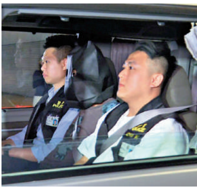
◀疑犯被黑布蒙頭，雙手扣上手銬，帶往警署。