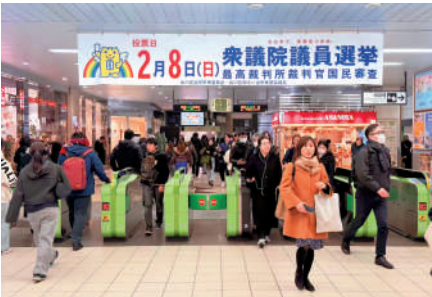
▲東京品川區一個地鐵站內懸掛著選舉日投票橫幅。