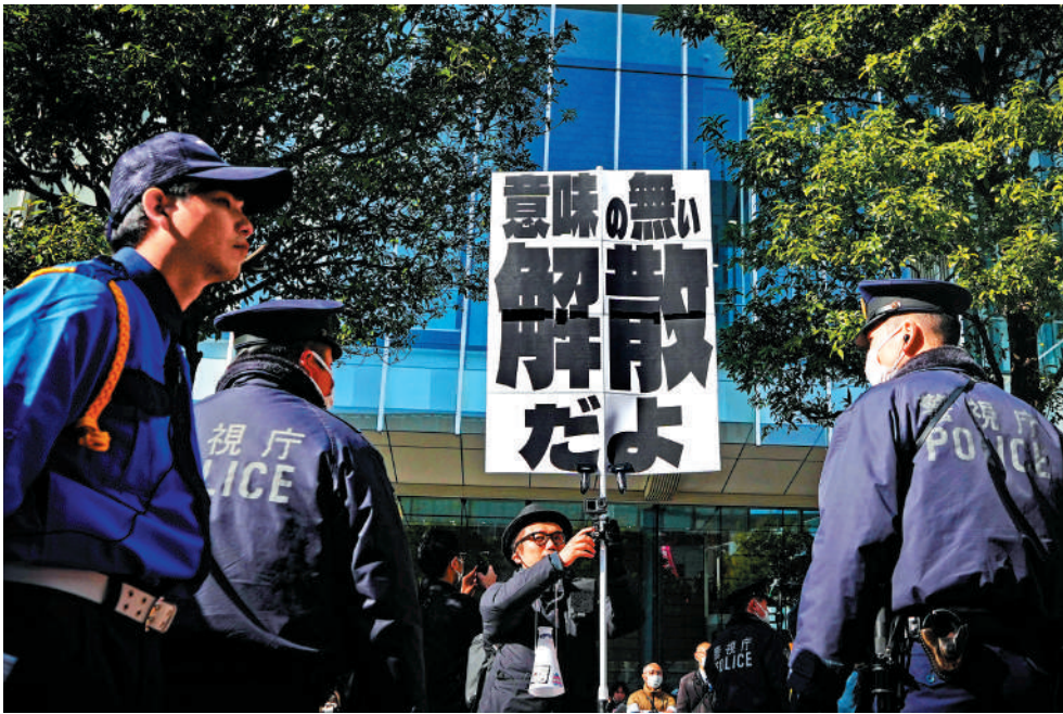
▲高市早苗近日在東京秋葉原車站附近造勢，有民眾舉起抗議標誌。