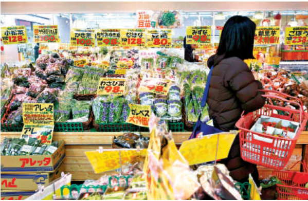
▲日本民眾最為關心國內經濟議題。圖為顧客在東京一間超市購物。