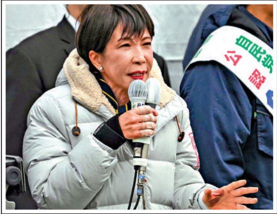
▲高市早苗7日在東京街頭拉票。

分析認為，高市早苗所代表的右傾保守路線，無論在經濟、民生還是對外關係上，都潛藏着不小的代價與風險。對日本選民而言，如何避免讓國家承擔不必要的政治與經濟成本，或許才是這場選舉中最值得深思的問題。