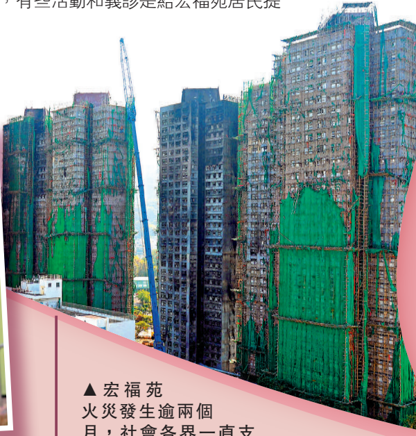
▲宏福苑火災發生逾兩個月，社會各界一直支援受災居民。

特區政府於大埔宏福苑火災後，成立「大埔宏福苑援助基金」，用於向受災居民提供支援服務，截至本月初，基金總額已達到46億元，當中3億元是政府投入的起動金額，其餘是社會各界的捐款。基金此前已推出11項援助，財政承擔額約為12億元。政府於本月初宣布，在基金下推出兩項新援助，包括向全部八座樓宇的業主或其家人發放每戶一次性的5000元春節心意金，向他們致以節日祝福。