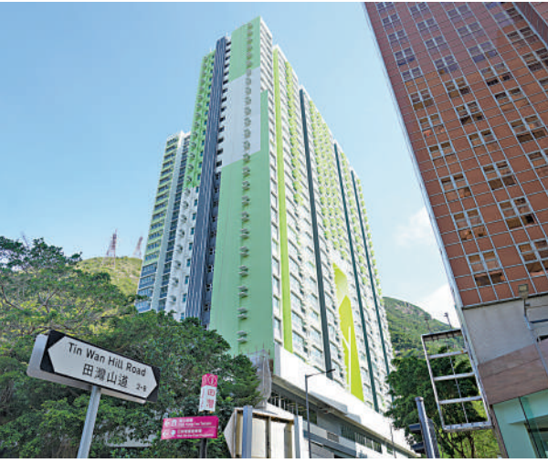
▲房協位於香港仔的漁映樓，是安置宏福苑居民的屋苑之一。