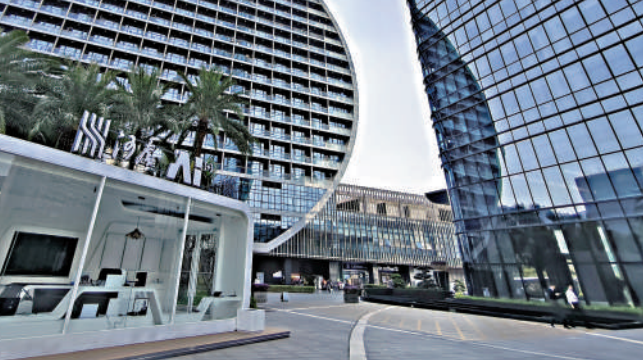
▲深圳河套深港科技創新合作區。