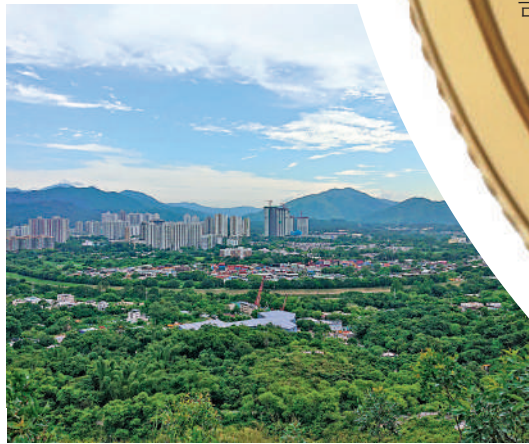
▲業界建議在北部都會區另闢園區，容納黃金精煉廠落地。