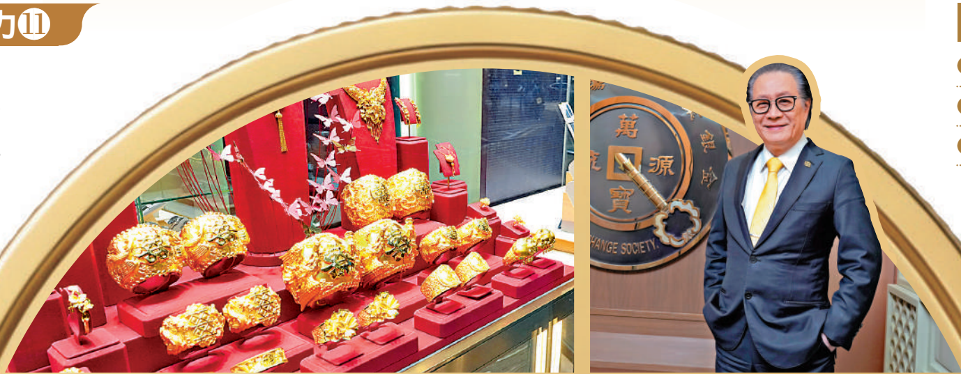
▲特區政府以黃金作為切入點，建立大宗商品交易生態圈，加速打造香港成為國際黃金交易中心。