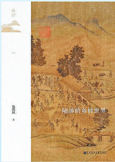
▲《陸游的鄉村世界》，包偉民著，社會科學文獻出版社，2020年。