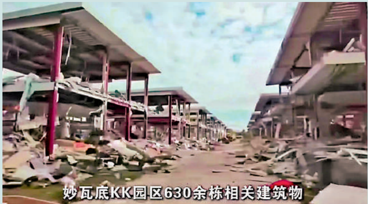
▲截至目前，妙瓦底KK園區630餘棟相關建築物已被全部拆除。