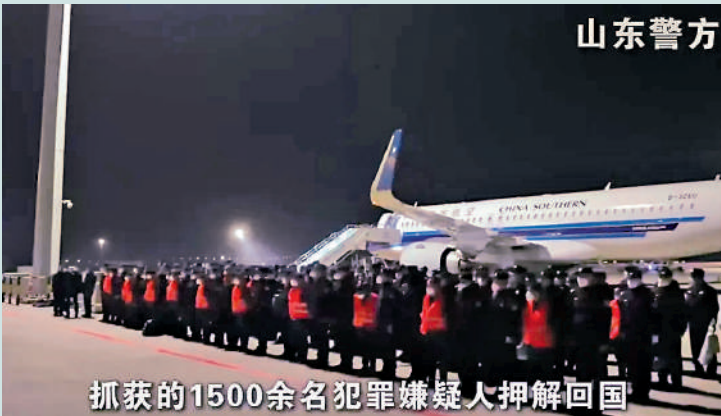
▲中緬泰聯合清剿緬甸妙瓦底賭詐園區行動取得重大突破。