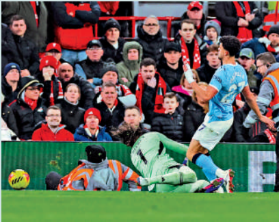
►曼城紐尼斯（右）被透出的艾利臣碰跌。