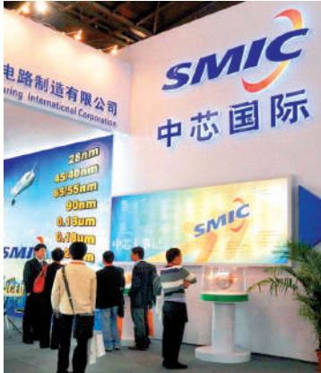
▲中芯國際為科指成份股權重前三位。

恒生科技指數旨在反映香港上市大型科技企業的整體表現，其成份股須與雲端、數字化、人工智能等六大科技