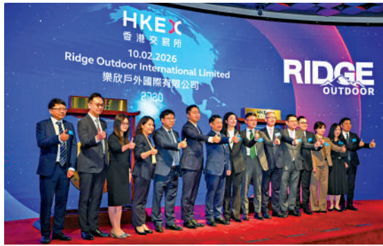
▲樂欣戶外首日掛牌收報24.78元，較上市價大漲一倍。

然而，AI芯片企業愛芯元智（00600）昨日股價表現讓投資者失望，全日收報28.2元，較上市價無升跌。至於在今日（周三）掛牌的先導智能（00470）或許也會讓人失望，因為昨日暗盤價在不同暗盤平台皆表現平平。在輝立平台的暗盤價收報46.66元，較上市價45.8元，高出0.86元或1.88%；按每手100股計，