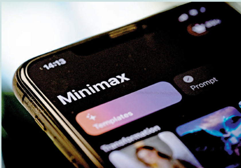
▲摩通給予稀宇科技目標價為700元。