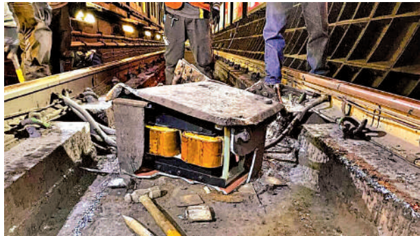
▲港鐵港島綫有信號箱疑被工程車勾爛，跌在路軌上。 ►港島綫昨早局部停駛近句鐘，大批乘客到站外輪候巴士。

【大公報訊】記者程進報道：港鐵昨日早上發生物件阻礙路軌事件，導致港島綫列車服務受阻逾1小時。事件懷疑是一個長闊約1呎、半呎高的信號箱被工程車勾爛，跌在灣仔站往金鐘方向的月台對開路軌，維修人員檢查後發現隧道段信號設備和路軌有受損，港鐵公司形容情況「少見」。