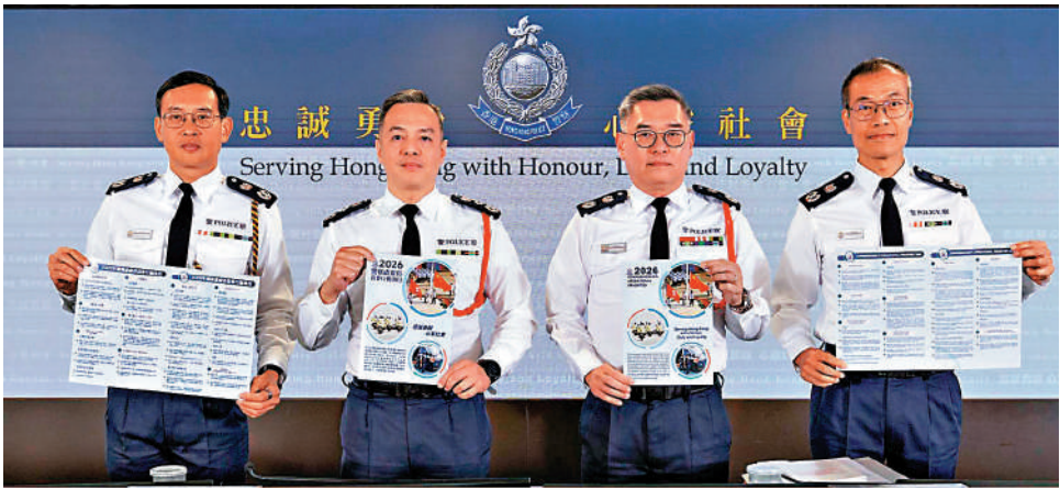
▲警方昨日總結香港去年治安情況，罪案宗數按年下跌5.9%。

去年各類罪行顯著下跌，爆竊跌幅最大，全年錄得816宗，按年跌33.1%，其次是行劫案，共66宗，是自1969年有紀錄以來最低。不過，詐騙案數量仍然高企，全年共計43212宗，佔整體罪案近一半，損失金額81億元，網上購物騙案成為最多的騙案類型，主要由於涉及演唱會門票的網絡騙案上升，警方相信與啟德體育園去年三月開幕有關。