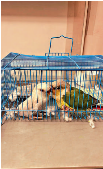
▲海關前日在深圳灣檢獲兩隻瀕危物種活雀鳥。

【大公報訊】記者馮錫雄報道：瀕危物種雀鳥及動物，在黑市市場買賣一直有價有市。香港海關本周二（10日）在深圳灣管制站，檢獲兩隻非法進口懷疑受管制瀕危物種活雀鳥，估計市值約1400元，車上一名男乘客被拘捕。 海關根據風險評估，該管制站截查一輛入境私家車，經檢查後在車上一個紙箱內的鳥籠，檢獲該兩隻瀕危活雀鳥，案件已轉交漁護署跟進。 根據《公眾衛生（動物及禽鳥）規例》，沒有有效健康證明書而進口禽鳥，即屬違法，一經定罪，最高可被罰款25000元。根據《保護瀕危動植物物種條例》，任何人如非按照《條例》規定進出口或管有瀕危物種均屬違法，一經定罪，最高可被判罰款1000萬元及監禁10年，有關物品亦會被充公。