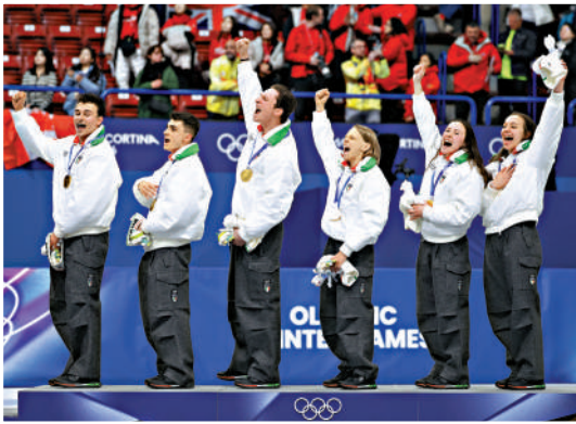
▼冠軍意大利隊在頒獎儀式上慶祝。

之一決賽到決賽3輪接力中，意大利發揮非常穩定，乾脆利落，沒有多餘動作。「我們其實沒有做特別精彩的超越，但是我們沒有犯錯誤，沒有失誤。這一點在大賽中我還是很欣慰的。因為在奧運會，而且是東道主，大家能發揮出這個賽季以來最穩定的一次滑行，這一點是很重要的。」她說。