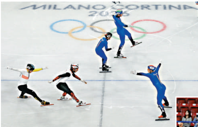
◀意大利隊（藍衫）在獲勝後慶祝。