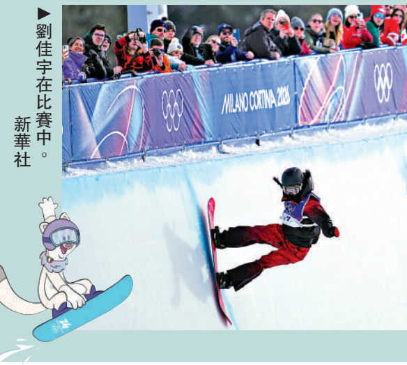
▶劉佳宇在比賽中。